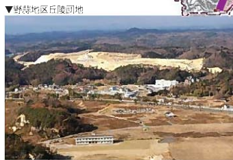
▲野蒜地区丘陵団地