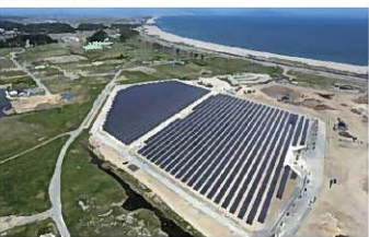
▲奥松島「陣」ソーラーパーク