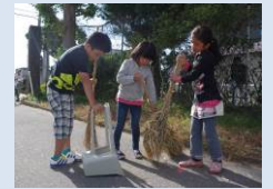
小学生による美化活動