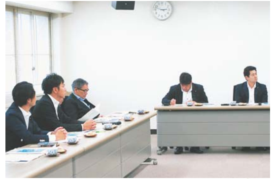
▲東京都大田区議会都市整備委員会の視察の様子

・東京都大田区議会都市整備委員会 「東日本大震災発生からのまちづくり (ハード面)」