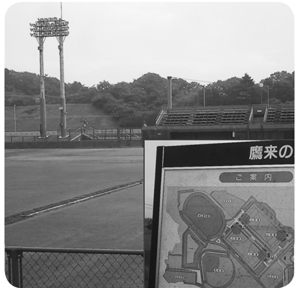
▲公式キャンプ地に最適地