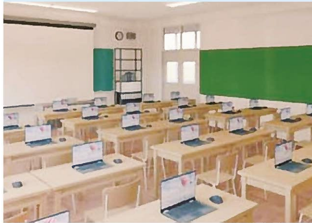
▲学びの進化は、一人一台の端末から