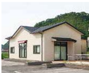
▲ふれあい・ぎわいの拠点として期待される

本条例は、過疎地域等自立活性化推進交付金を活用して、小野地域コミュニティ再生事業を行い、地場産品のブランド化や販売等について、事業を具現化するための拠点として整備したものです。全国的に少子高齢化が進み、本市においても例外ではありません。特に買物弱者等の問題もあるため、地場産品の直売等による、地域内の(人・物・サービス)を循環させ、地域の暮らしを地域で支える活動拠点として、ふれあい交流館を整備しました。