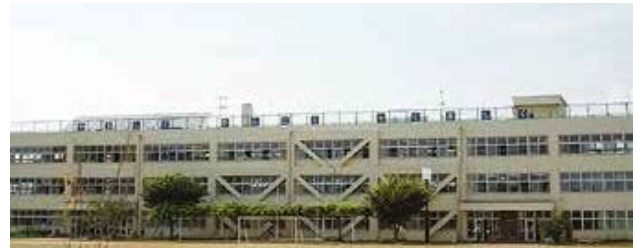
▲冷房機が設置される大曲小学校