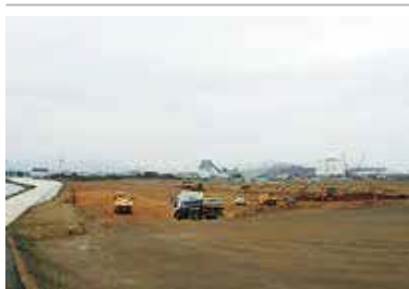
▲着々と建設工事が進行中 (平成30年6月、上浜橋より撮影)

本条例は、東日本震災前は矢本海浜緑地公園として市民に利用されていた大曲浜地区に、昨今、北海道を中心に全国的に普及してきているパークゴルフ場を設置するというものです。概要は、6コースで54ホール、面積は約8ヘクタールの施設となり、基本、年末年始以外は休場日が多く、使用料は高校生以上が500円、中学生以下が300円です。市民の皆さまが楽しみながら運動をして、健康の維持管理を目指していく施設となります。