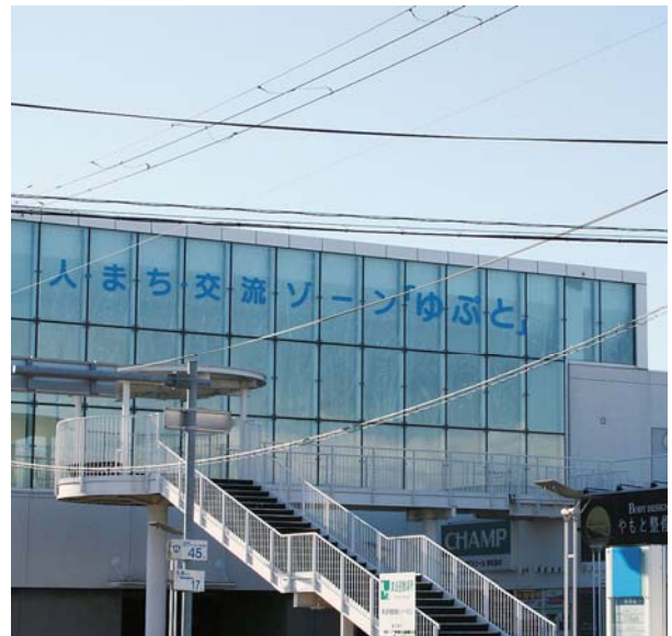
▲健康増進の拠点としての中核施設