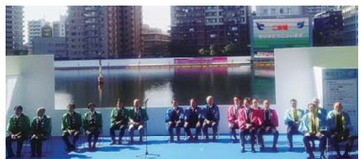
▲大田区の友好都市、秋田県美郷町、長野県東御市とともに参加しました

その後、豊前市内の「うみてらす豊前」や求善提資料館を訪問し、豊前市の伝統文化への理解を深めました。