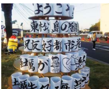
▲豊前市の皆さまの厚い歓迎に感謝申し上げます

審査は、二日間にわたり実施し、指定管理者候補者の(株)ダンロップスポーツウエルネスの類似施設の運営実績、収支計画書の状況、選定基準、審査方法、評価の経過、仮契約書の内容について実施しました。 委員間討議においては、各委員から①使用者の平等な利便性が確保されるよう事務の引き継ぎに万全を期すこと②協定書の確実な履行についての意見が出されました。 民生教育常任委員会の採決の結果、原案可決すべきものと決し、本会議では、委員長報告があり、全会一致で原案どおり可決されました。