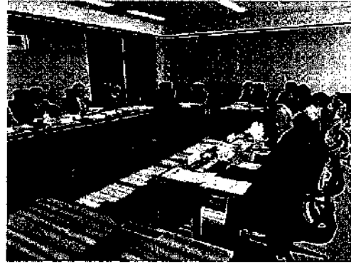
新富町役場内 研修状況