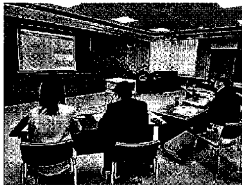
宮崎市役所内 研修状況