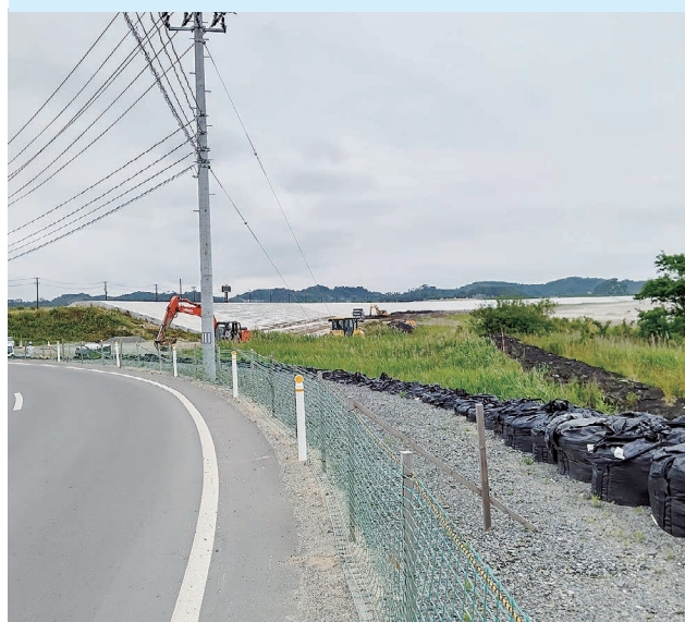
▲復興事業の完結と待たれる野蒜海水浴場の再開

つ暮らし」を6月に開設し、ふるさと回帰支援センターと移住コーディネーターとともに取り組みを進める。