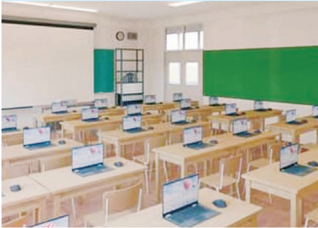
▲学びの進化は、一人一台の端末から