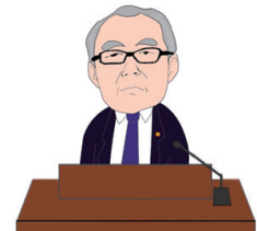
小野 恵章 議員

【答】 特定検診や健康診断、肺がん検診、大腸がん検診は12月の実施に向け、会場の確保や方法等の調整を行っている。