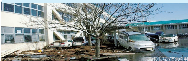
被災状況写真集引用