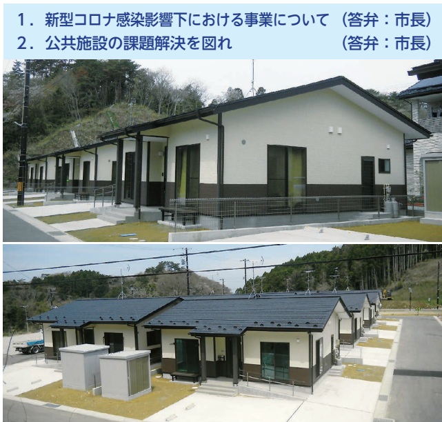
▲戸建て災害公営住宅の譲渡希望調査を行う予定