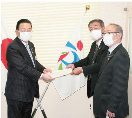
▲正副議長が市長へ提出(5/26)