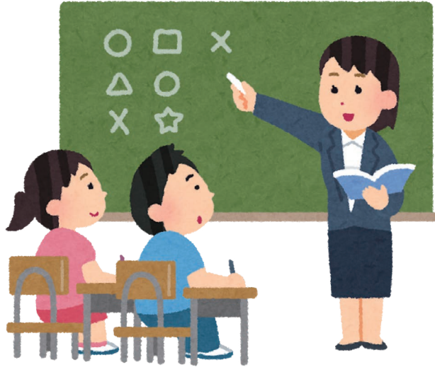
▲児童生徒に負担のない学校再開を