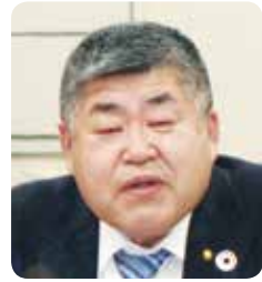
千葉 修一 議員