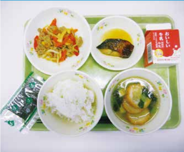
▲給食費の負担はどうするか？

問 ふるさと納税の現状について伺う。答 原材料価格やエネルギー価格などの値上がり、さらに円安による物価高騰から各自自治体のふるさと納税返礼品にも影響が見受けられる。本市でも、牡蠣や牛タン商品などに影響がみられ、納税額は前年度比で現在約80%である。新規返礼品として「牡蠣鍋」などの開発を進めている。