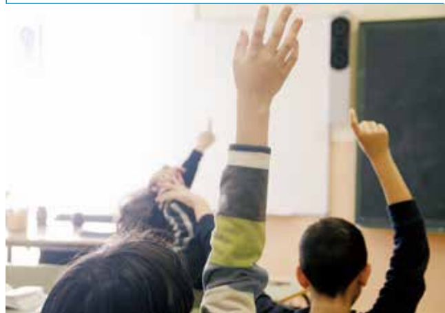
▲子どもたちの積極的な発言