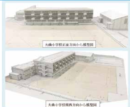
▲津波対策、防災機能を有する大曲小学校改築計画

て前向きに検討している。 3件目 問 本市の中学校不登校発生率は、全国・県平均を上回っている。どのような取組で多様な教育機会の確保を進めるのか。 答 不登校相談員、巡回相談員を配置し、別室での学習や生活相談、家庭訪問、また、子どもの心のケアハウスでの個別に合わせた学習サポートや相談も行ってはいる。 問 富谷市では今年4月から多様な学びを支援する場として不登校特別校を開校し好評であるが所見は。 答 承知している。本市では、子どもの心のケアハウスを来年度、「ふれ愛市民活動プラザ」に移転し、広く落ち着いた環境のなかで支援体制を一層拡充させたい。