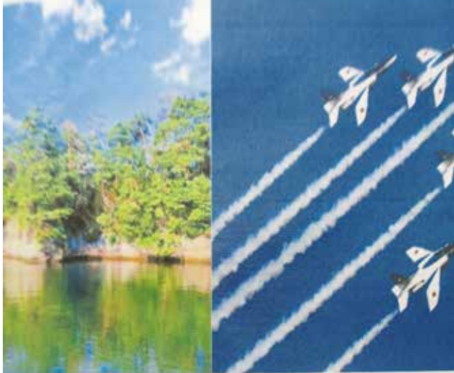
▲東松島市をまるごとブランド化してまちおこし