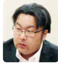
齋藤 徹 議員