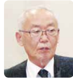
小野 恵章 議員

人口減少傾向に歯止めをかけるべく、現状の施策を見直し、強化が必要と思慮することから所見を伺う。 問 若い世代に安価な住宅地を提供したいとしているが、その具体策は。 答 今年度中に矢本、大曲、赤井柳地区における開発の可能性がある地区の土地所有者への意向確認を実施し、計画への位置付けに必要な調査を実施すべく速やかに事業推進する。すでに計画に位置付けている赤井柳の目南工区は、駅隣接の利点を活かした土地活用を検討する。イオンタウン東側から東松島消防署西側までの23・1haは、土地所有者の意向を踏まえ合意