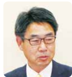
阿部 秀太 議員