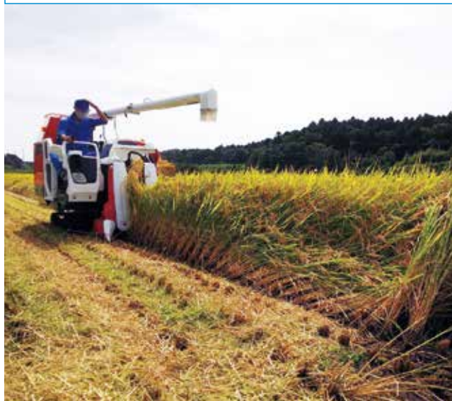
▲農業機械の更新時への支援策を

いる。特に、漁場環境改善の方法として、海底耕耘などの取組は効果的であると考え、地元漁業者からも要望があることから、過去に県で取り組んだ「松島湾リフレッシュ事業」の実施について、地元選出の県議に要望して12月県議会で県知事に對し一般質問を行っていた。