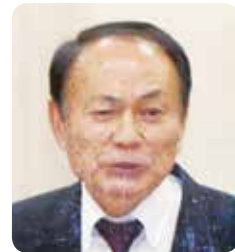
土井 光正 議員

1件目 問 大曲小学校の改築は津波対策を充実すべき。 答 地域の避難所としての利用を考慮し、津波対策も含む防災機能を強化して整備する。 2件目 問 学校給食費負担軽減について、来年度の検討状況を問う。 答 令和5年度は、市費による食料費高騰分の補填や子育て家庭への経済的負担軽減策として給食費の一部軽減を検討している。 問 障がい認定を受けられない高齢者の補聴器購入補助の検討状況は。 答 令和5年度当初予算に計上できるよう、対象要件、助成金額等について