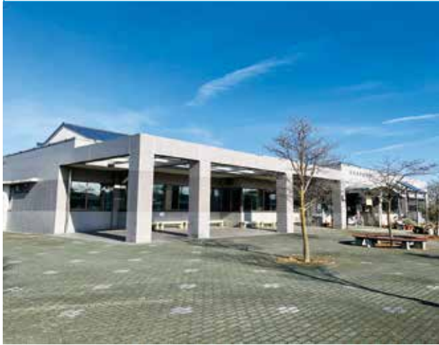
▲読書時間を楽しめる滞在型の図書館へ