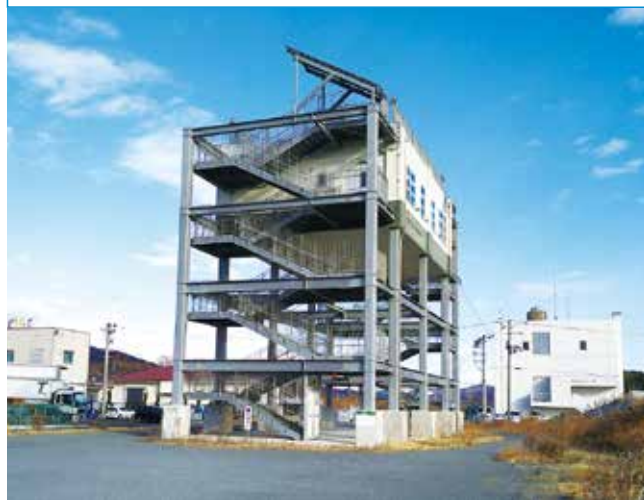
▲待たれる津波避難タワーの整備