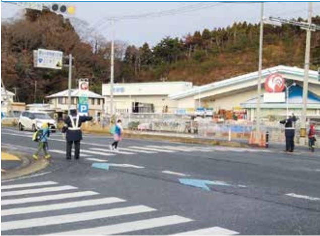
▲交通の指導整理にあたる交通安全指導隊