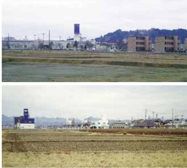
▲官民協働での早急な市街化区域拡大を望む