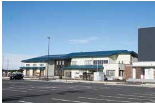
▲矢本東市民センター