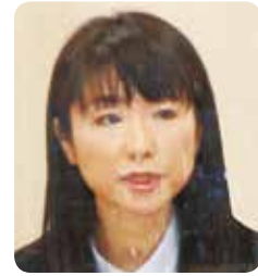
浅野 直美 議員