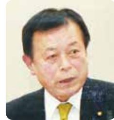
櫻井 政文 議員