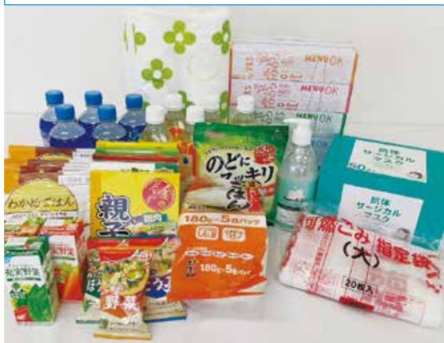
▲濃厚接触者自宅待機世帯への生活用品や食料品等の支援助資

は、年4回の定期募集となっているが、入居サービズ、人口減少を防止するため、現行制度を改善する考えはないか。