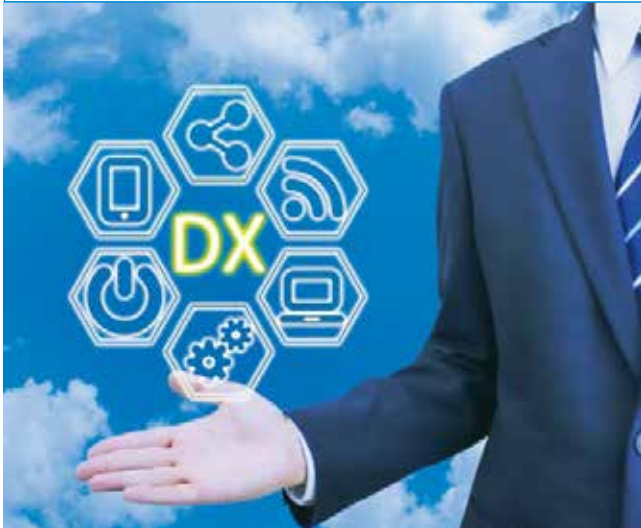
▲本市のデジタル推進は多方面にわたり推進していく