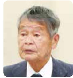
滝 健一 議員