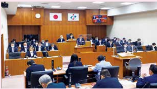
傍聴席から見た議会の様子