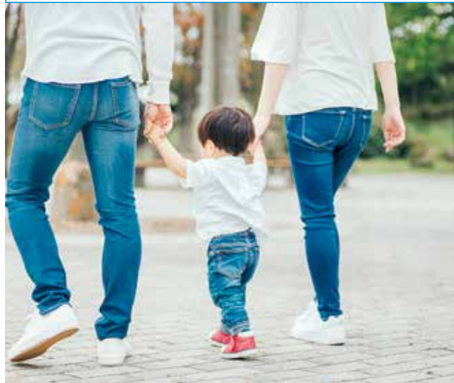
▲子育て世帯の負担軽減を

均等割額は第2位。他との比較で子育て世帯の負担は大きく、軽減すべきである。軽減費用の650万円は、6億円の国保基金の一部を取り崩せば十分できるはずである。