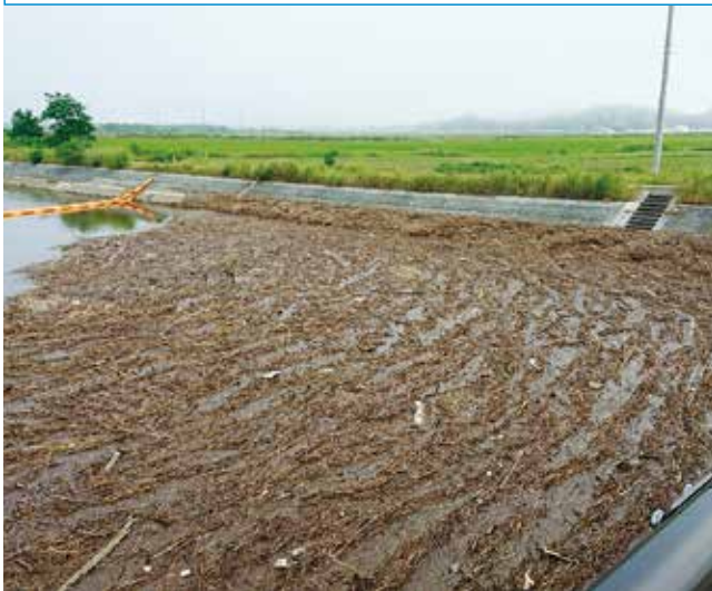
▲7月の豪雨で東名運河へ流れ込んだ葎