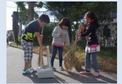
小学生による美化活動