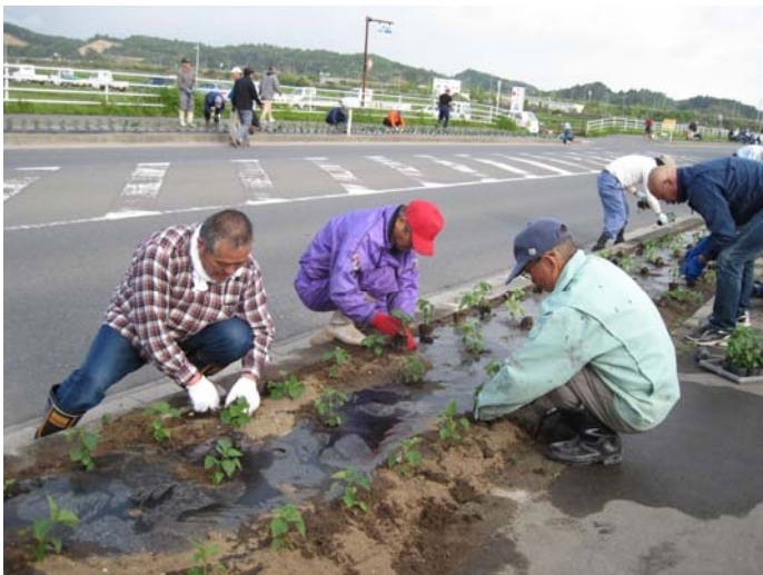
市民による花の植栽

市民が身近に自然とふれあい「うるおいのある自然環境を創る」ための緑化活動の一環として、花いっぱい運動や国道沿線のフラワーロード事業などの活動は、身近な自然環境の創造として大変有効な事業です。