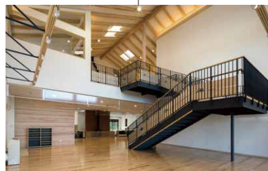
●交流展示スペース