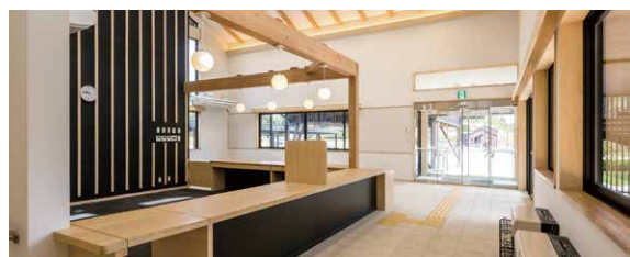
●観光物産交流センター