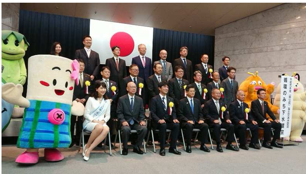
国土交通省での表彰式の様子

この取組は、矢本西小学校、及び父兄の外、本市と同じく大規模災害を経験した熊本県熊本市と連携の上、実施したものです。