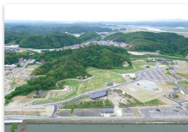
マレットゴルフ場