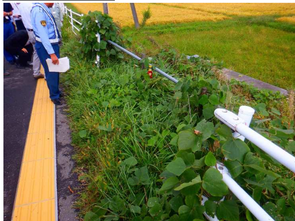
現場写真② 復元想定イメージ図