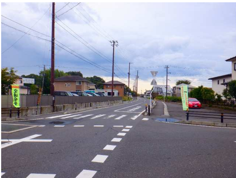
現場写真②【実施済の状況】