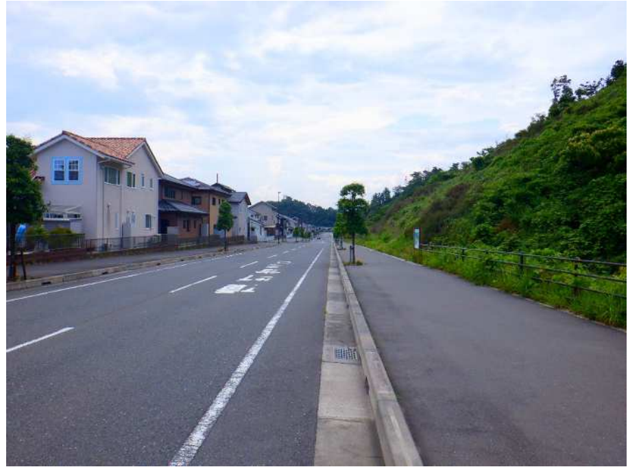
現場写真② 対応完了写真