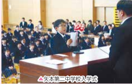
矢本第二中学校入学式