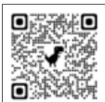
日本年金機構 ホームページ

■問 日本年金機構石巻年金事務所 ☎22-5115(自動音声案内) 市民生活課国保・高齢医療・年金係 ☎内線1337