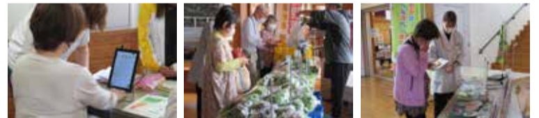
▲測定は10秒! ▲地元野菜を食べてスコアアップ! ▲ベジアップのポイントアドバイス