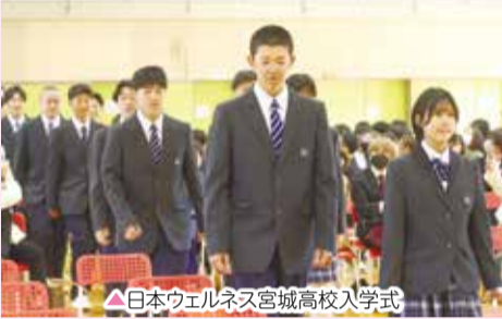
日本ウェルネス宮城高校入学式