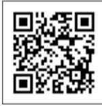
宮城県母連ホームページ