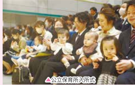
公立保育所入所式