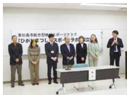
▲ひがしまつしまスポーツラボの役員

令和8年3月30日、東松島市総合型地域スポーツクラブ「ひがしまつしまスポーツラボ」が設立しました。今年度から、子どもから大人まで市民が楽しく参加できるスポーツ教室やイベントを開催します。「明るく元気な東松島市」をモットーに活動していきます。