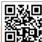
ゆぶとホームページ