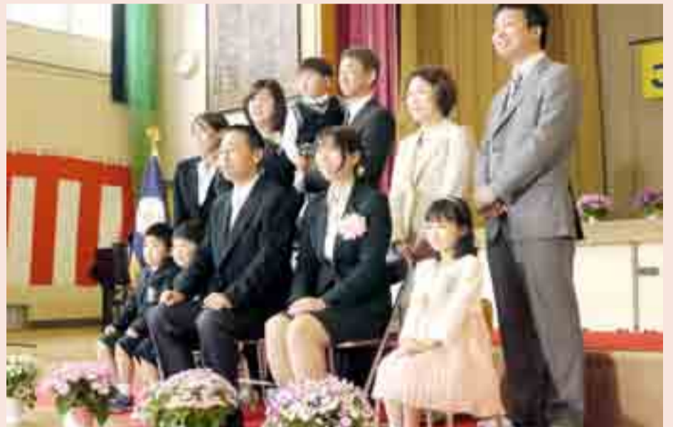
▲いよいよ小学生。期待を胸に記念撮影に取まります(4月9日、宮戸小学校)