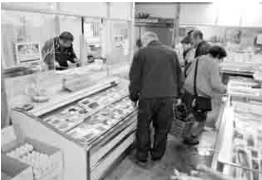
▲新鮮な魚介類を求めてにぎわう店内

最近考えてしまうのが、お店の再建のこと。私としては「改めて店を構えて」と思っていますが、やはり肝心なのは国がどう支援してくれるかが不安です。まだ先は分かりませんが、その点を見極めたいですね。