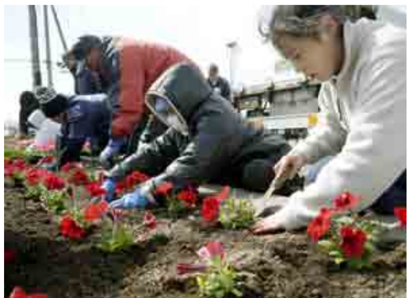
▶花のまちづくりを進める熊本県宇城市から、カザニア、ペチュニアなどの花苗が寄贈され、大曲市民センターでは市民らが植栽に取り組みました。グリーントウンやも仮設住宅には熊本の皆さんが植栽したメッセージ付きのプランターが届けられました(4月4日)