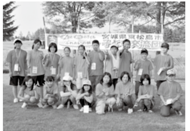
▲この夏、北の大地で絆と友情を育もう (平成23年度交流事業での一コマ)

■問・申し込み 東松島市教育委員会生涯学習課 ☎内線3300 〒981-0503 矢本字大溜1-1 市コミュニティセンター内