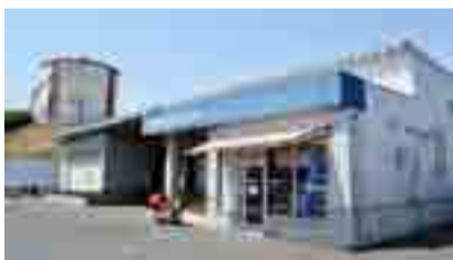
▲オイタミート矢本工場 (グリーンタウンやもと工業団地内)

家庭で普段から安心して食べられる食肉を提供したいとして先代が精肉店と養豚業を始めた昭和32年から、豚肉にこだわり続けてきました。同50年代には卸売業へ法人化し、大塩の矢本工場は平成16年1月から稼働して