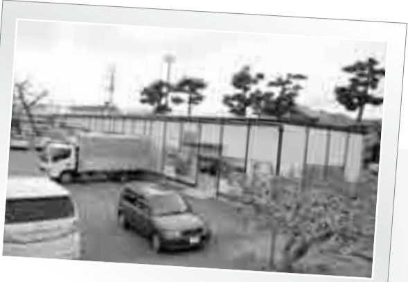
堺堀 (矢本運動公園)

仮設店舗で人生の再出発を誓った店主たちは、懸命に、一歩ずつ前を目指しています。くじけることなく、笑顔をやささず営業を続ける復興仮設店舗の店主たちの代表4人に、現在の様子などを語っていただきました。