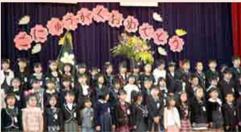
▶矢本東小学校では85人の新一年生が入学しました(4月9日)