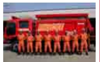
▲救助工作車と一緒に整列する矢本消防署特別救助隊員