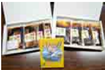
▲同社の商品。左の豚の角煮は先月1万個を売り上げる大ヒット

特に生産者が苦労して育て上げた豚をより高く購入し、無駄なく加工することでそれに報いたいと日々奔走。4月下旬からハム・ソーセージの製造工場を敷地内に設け、さらに衛生処理施設も設置。食肉処理・卸だけで