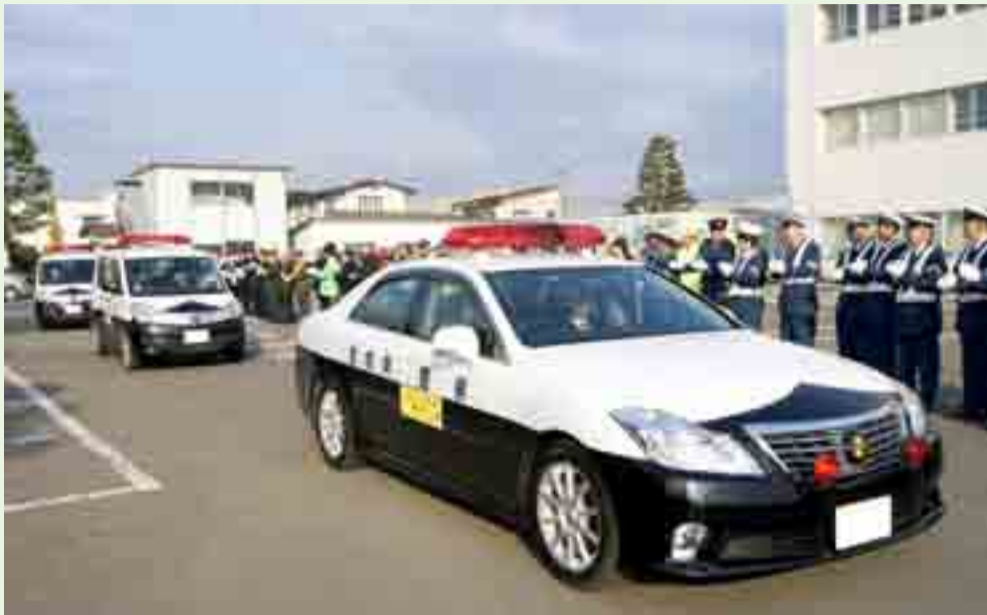
▲関係者の拍手を受けてパトロールに出発する警察車両（4月6日、市役所駐車場）

初日の出動式には石巻地区交通安全協会矢本・鳴瀬両支部、市交通安全指導隊など約100人が集まり、士気を高めました。引き続き、市内JR各駅で「駅前交通マナーアップ作戦」が行われ、駅利用者に運動をアピールしました。