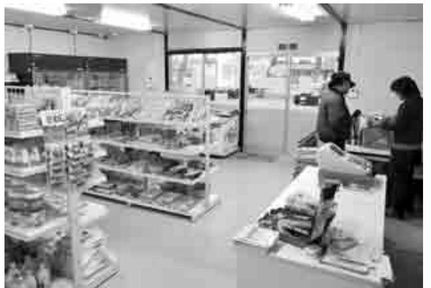
▲食料品だけでなく、幅広い日用品も取り揃えています

オリジナルの日本酒が好評で、震災後に第2弾を作りました。東京都内で開かれた復興支援イベントでも販売したら、たくさんの皆さんに購入していただきました。ありがたいことです。