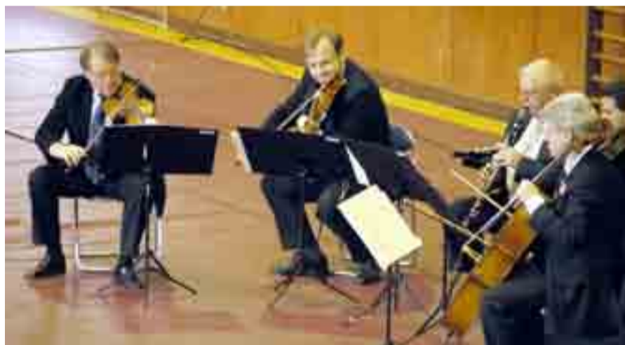
▲「トヨタ・マスター・プレイヤーズ、ウィーンふれあいコンサート」（トヨタ自動車主催）が開かれ、ウィーン・フィルのメンバーら6人が重厚な音色で来場者を魅了しました（4月8日、石巻西高等学校）