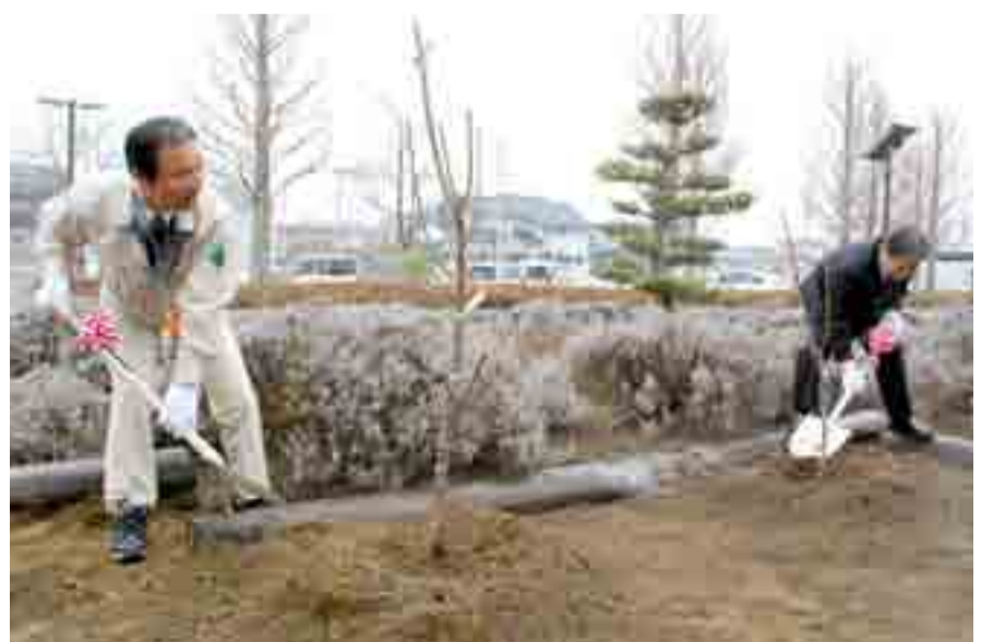
▶昨年12月に友好都市協約を結んだ山形県東根市から贈られたサクラノボの苗木4本が市図書館前に植えられました（4月12日）