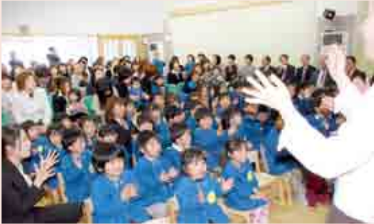
▶社会福祉法人矢本愛育会が整備した矢本西保育園が完成し、初めての入園式が行われ、0〜5歳児76人が童謡を歌って祝いました(4月5日)