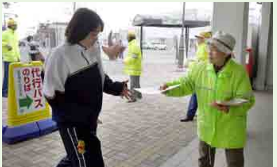
▲JR矢本駅前ではチラシを配布し、利用客に交通安全の周知を図りました（4月6日）