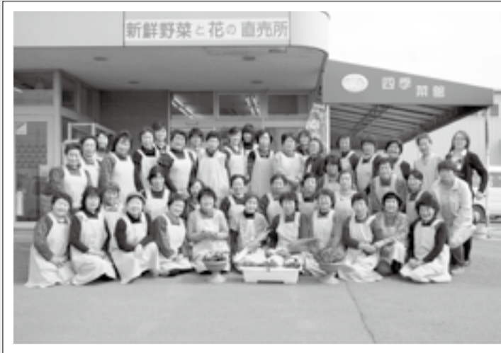
▲四季菜館の会の皆さん

営業時間／9時～16時30分 定休日／毎週火曜日 所在地／大塩店：大塩字南21-1 矢本店：矢本字上河戸25-7 (Aコープ矢本店内)