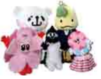
▲前列左より、ピンク、セグピー、ニューピンク(以上、小山市のマスコットキャラクター)。後列左より、開運★おやまくま、かぴょ丸くん(以上、小山ブランド公認キャラクター)