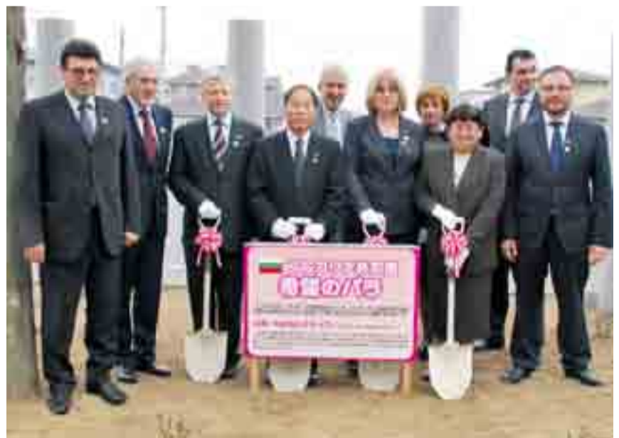
▶ブルガリア共和国国民議会のソエツカツァエヴァ議長一行が訪れ、市内の被災状況を視察した後、市コミュニティセンター前で、同国国花のバラの記念植樹をしました（4月11日）