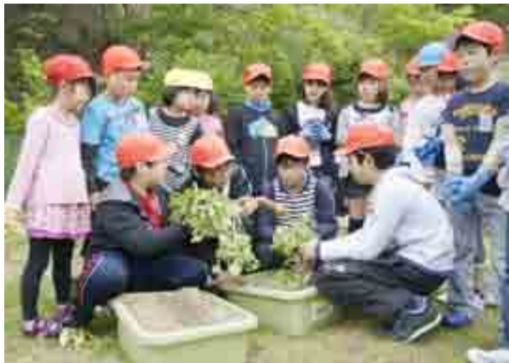
▲宮戸小学校では、ハマボウフウ・ハマヒルガオの苗植えが行われました。来校した専門家の指導を受けた後、元気に育つように願いを込めて、児童全員で苗をプランターに植えました(5月25日)