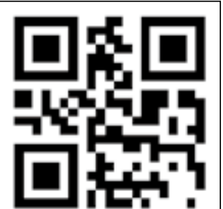
登録用二次元バーコード