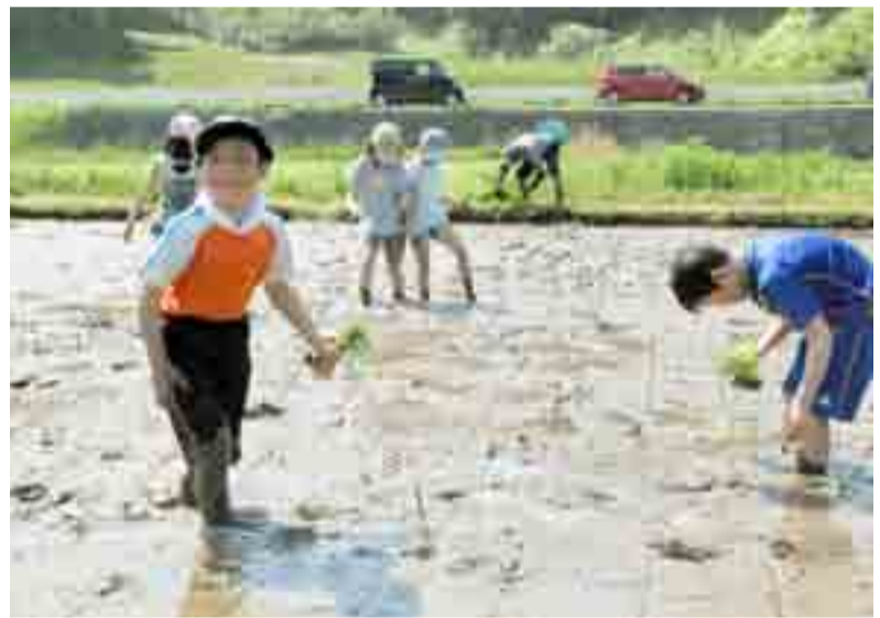
▲地域の小学生が伝統行事や自然体験する「思い出づくりあおぞら学校」が開校し、初回は田植えが行われました(5月20日、高松地内の水田)