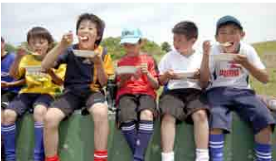
▲被災地の子どもたちを元気づけようと、ネパール料理店「カトマンドゥ」(仙台市)が、炊き出しを行い、チキンスープカレーを振る舞いました。東松島サッカー協会所属のNARUNO F.C.、F.Cインパルス、矢本F.C.、広瀬S.S.Sのメンバーが本場の味を堪能しました(5月26日、鷹来の森運動公園)

地域全体で子どもを育てる環境づくりを目的とした「宮城県協働教育プラットフォーム事業」が市内各地区で行われています。学校と地域・市民センターなどが一体となり、さまざまな体験学習を通じての豊かな学びを応援しています。