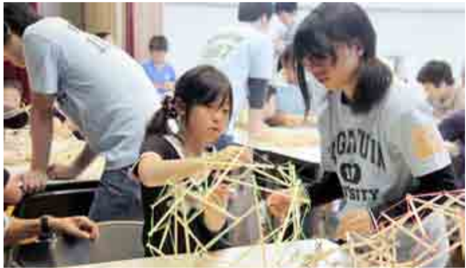
◀学校法人工学院大学II本部・東京都新宿区IIは、矢本東小学校で出張理科教室を開きました。市内の小中高校生ら約800人が参加し、実験や創作活動を通じて科学の世界に親しみました(5月27日)