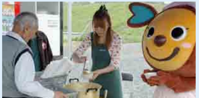
▲いーなショップ・グリーン(場所:グリーンタウンやもと第2仮設住宅駐車場内、運営主体:㈱奥松島公社)では、毎月17日を「いーな(17)の日」として来店したお客さん向けのさまざまなイベントを開催。5月の「いーな(17)の日」では、豚汁のお振舞いが行われました。また、東松島市キャラクター イートの妹 イ〜ナが登場してイベントを手伝いました(5月17日)