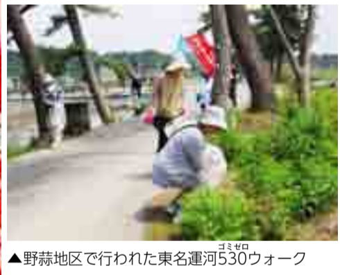
▲野蒜地区で行われた東名運河530ウォーク