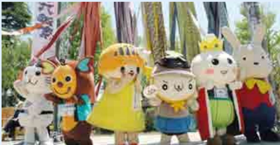
▲岩手県盛岡市で開催された『東北六魂祭2012』に、東北6県を代表するご当地キャラクターが集まって「東北のご当地キャラ 東北たまSIX」を結成し、お祭りと復興への機運を盛り上げました。東松島市キャラクター イートが宮城県代表として参加しました。写真左から、秋田県:ニャジロウ(秋田市のデザイン事務所 ネコヤナギ)、宮城県:イート、岩手県:開運かなえちゃん(盛岡駅前商店街振興組合)、山形県:かねたん(社)米沢観光物産協会)、青森県:たっこ王子(田子町)、福島県:ももりん(社)福島市観光コンベンション協会(5月26・27日)