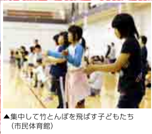
▲集中して竹とんぼを飛ばす子どもたち (市民体育館)