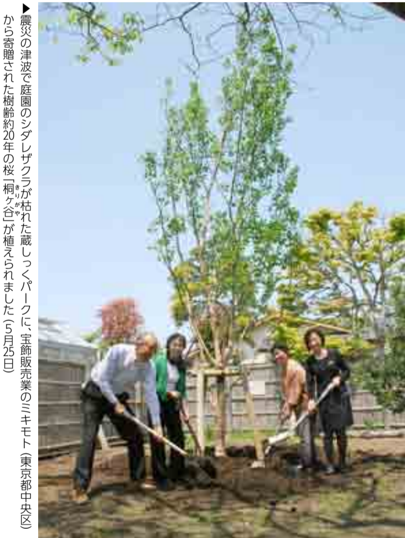
▶震災の津波で庭園のシダレザクラが枯れた蔵しっくパークに、宝飾販売業のミキモト(東京都中央区)から寄贈された樹齢約20年の桜「桐ヶ谷」が植えられました(5月25日)