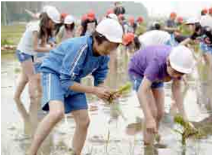
▲大塩小学校の5・6年生86人による田植え作業が行われ、子どもたちが苗を1本ずつ植えていきました(5月23日、大塩字表地内の水田)