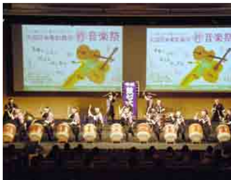
▲東松島市への復興支援を続けている大田区が主催した「3・11東日本大震災を忘れない 大田区&東松島市絆音楽祭」が開催されました。東松島からも音楽家や芸能団体などが参加し、音楽を通じて絆を深めました(5月19日、東京都大田区西蒲田・日本工学院専門学校3号館)