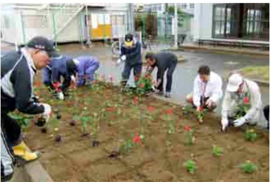
◀川前ふれあい公園花壇に、イオンタウン株式会社(千葉県千葉市)からの支援を受けて、サルビアやマリゴールドが植栽されました。一日も早い復興を願う同社社員と赤井南区東自治会住民などが共同で作業しました(6月17日)