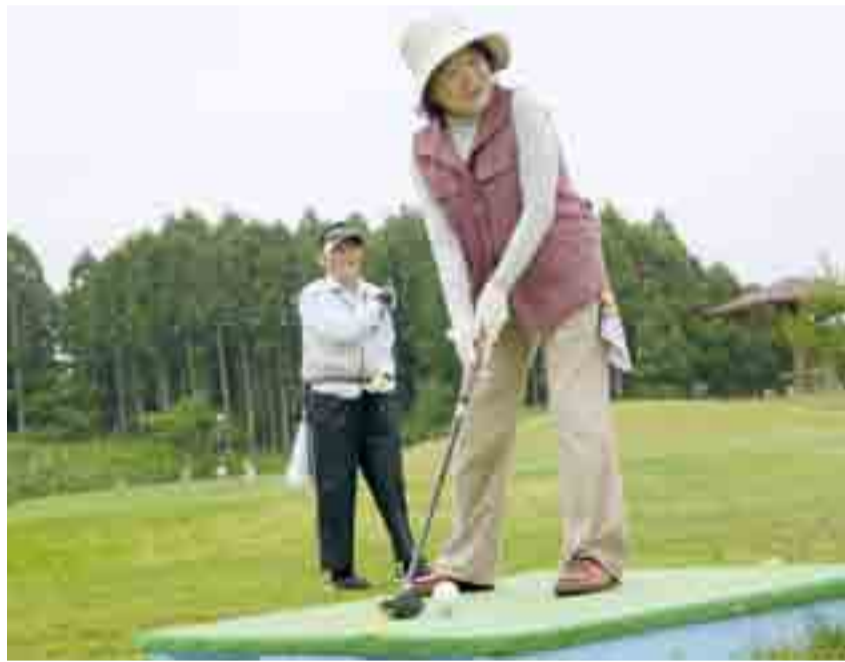
▲大曲市民センター主催のパークゴルフ大会が開かれ、愛好者43人がはつらつとプレーしました(6月22日、かなんパークゴルフ場)

◀市内のさまざまな施設の修繕やイベントなどの支援をしている「特定非営利活動法人児童養護施設支援の会の皆さんが、旧牛網保育所のごとも広場の再開に向けた修繕や清掃活動、植樹などを行いました(6月15日)」