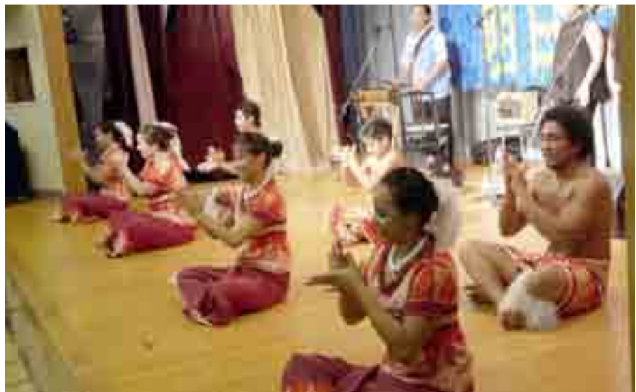
◀南国ムード満点のポリネシアダンスショーが催され、本場ハワイのダンサーたちがステージを披露し、観衆を魅了しました(6月23日、小野市民センター)