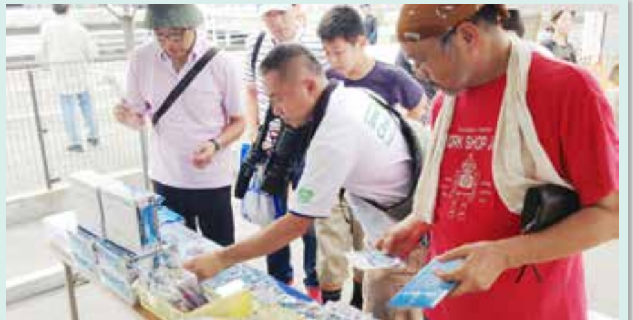
愛知県瀬戸市で第81回せともの祭が開催され、会場内で復興支援として東松島市物産展が行われました。のりやブルーインパルスグッズなど特産品の販売ブースを設けました(9月14~15日、愛知県瀬戸市・名鉄瀬戸線尾張瀬戸駅前)