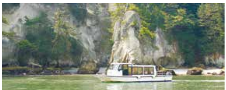
写真は震災前の嵯峨溪遊覧の様子