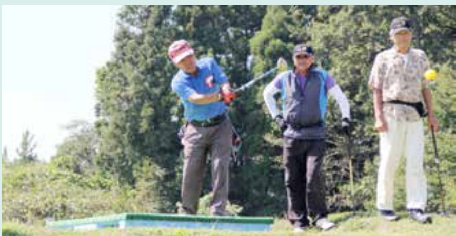
晴れ渡った秋空の下、大曲市民センター主催の「パークゴルフ大会」が開かれ、36人の参加者が4コース(各9ホール)で自慢の腕を競い合いました(9月20日、かなんパークゴルフ場)