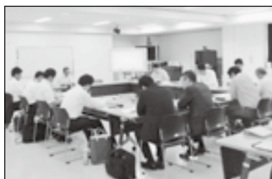
▲9月に開催された産業部会の様子

「HOPE産業部会」は、東松島市復興まちづくり計画に緊急性・重要性の高い施策として位置付けられた重点プロジェクトのうち、産業経済分野に関する地域産業の持続・再生プロジェクトの実現を目指しています。