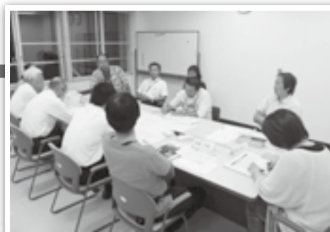
▲活発な意見交換が行われた(観光資源の再構築と魅力づくりグループ)