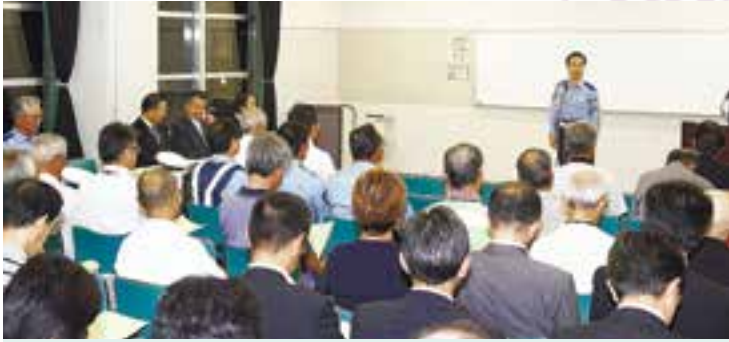
秋の交通安全県民運動の出動式が行われました。出席した交通ボランティアや警察関係者ら約100人は、交通事故撲滅への決意を新たにしました。運動期間中、市内では飲酒運転の根絶を呼び掛ける広報活動や高齢者に交通安全を学んでもらう集会などが繰り広げられました(9月20日、市コミュニティセンター)