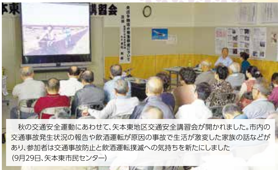
秋の交通安全運動にあわせて、矢本東地区交通安全講習会が開かれました。市内の交通事故発生状況の報告や飲酒運転が原因の事故で生活が激変した家族の話などがあり、参加者は交通事故防止と飲酒運転撲滅への気持ちを新たにしました(9月29日、矢本東市民センター)