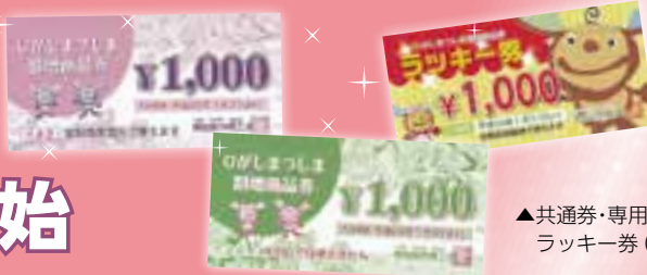
▲共通券・専用券・ラッキー券(見本)

この商品券は、東日本大震災で被災した市民の皆さまの生活支援と市内各店舗の売り上げ向上によって、地域経済の活性化を図ることを目的に発行します。この機会にぜひ利用ください。