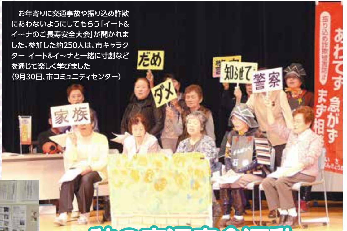
お年寄りに交通事故や振り込め詐欺にあわないようにしてもらおう「イート&イ〜ナのご長寿安全大会」が開かれました。参加した約250人は、市キャラクター イート&イ〜ナと一緒に寸劇などを通じて楽しく学びました(9月30日、市コミュニティセンター)