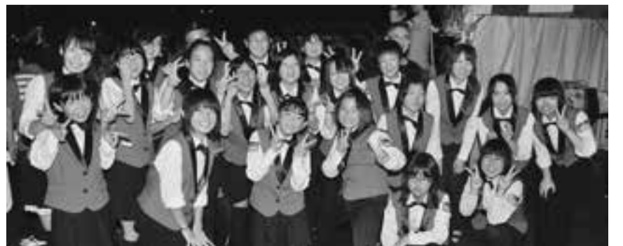
▲昨年の仙台定禅寺ストリートジャズフェスティバル・フィナーレに出演しました