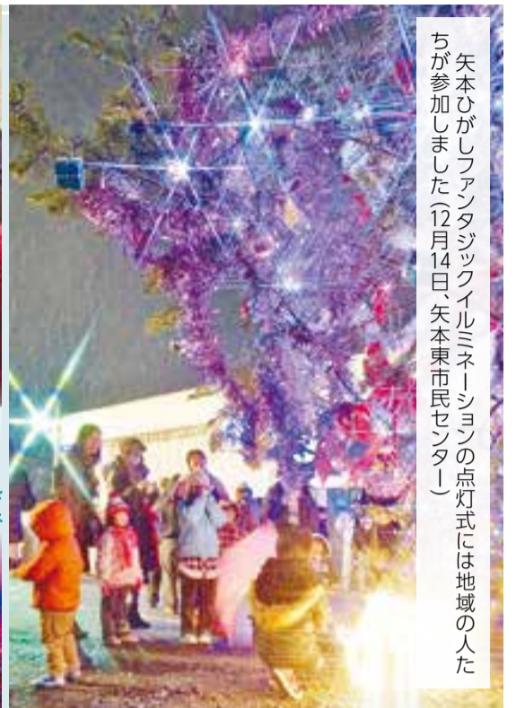
矢本ひがしファンタジックイルミネーションの点灯式には地域の人が参加しました(12月14日、矢本東市民センター)