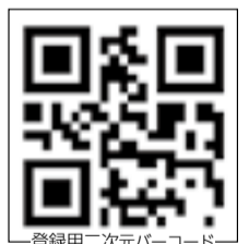
登録用二次元バーコード