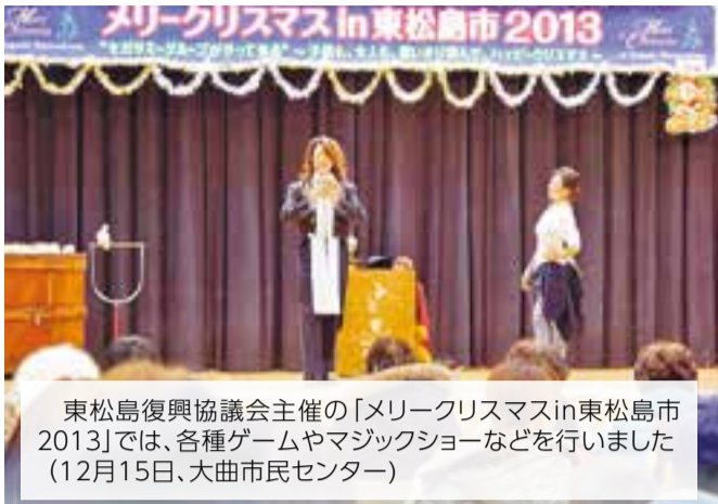
東松島復興協議会主催の「メリークリスマスin東松島市2013」では、各種ゲームやマジックショーなどを行いました(12月15日、大曲市民センター)