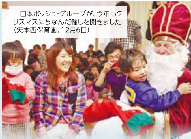
日本ボッシュ・グループが、今年もクリスマスにちなんだ催しを開きました(矢本西保育園、12月6日)