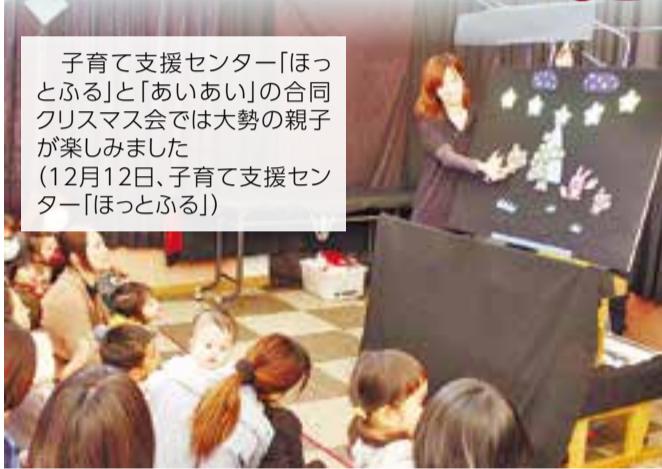
子育て支援センター「ほっとふる」と「あいあい」の合同クリスマス会では大勢の親子が楽しみました(12月12日、子育て支援センター「ほっとふる」)