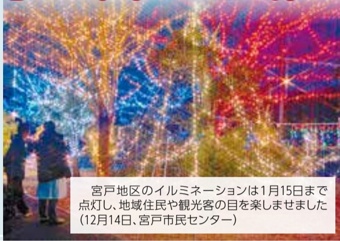
宮戸地区のイルミネーションは1月15日まで点灯し、地域住民や観光客の目を楽しませました(12月14日、宮戸市民センター)

クリスマスから年末年始にかけて、市内各地でイルミネーションが輝き、子どもたちを楽しませるイベントが行われました。