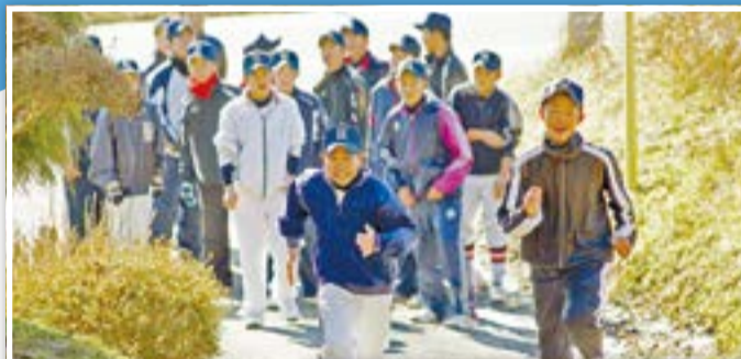
▼東松島リトルシニアのみなさん