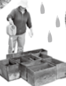
資料館スタッフも水やりがんばりました◎