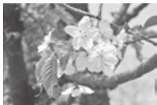
春、島を彩るヤマザクラ (学名:Prunus jamasakura)

そして今春、いよいよ育てた苗木を植樹することになりました。今回はそんなヤマザクラプロジェクトの活動をご紹介します!