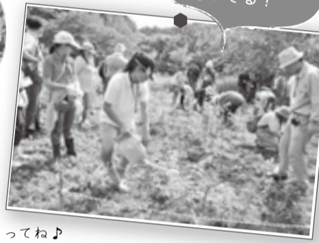
暑いけど、すくすく育ってね♪

2014年春 いよいよ植樹祭開催! そして、いよいよ育てた苗木を島内に植樹します。最初の場所として選んだのは、島の玄関口から延びる街道沿い。今まで再生プロジェクトや縄文村イベントにご参加いただいた方はもちろん、はじめてという方もお気軽にご参加下さい!