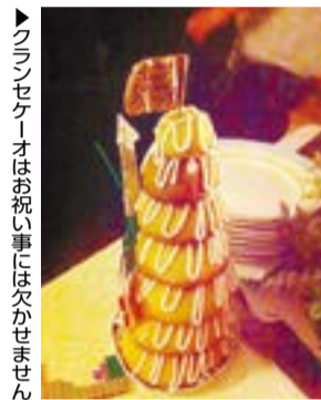
▶克蘭セケーオはお祝い事には欠かせません

震災後、東松島市は北欧のデンマーク王国からさまざまな支援をいただいています。デンマークがどのような国なのか、毎月1日号で紹介(連載)していきます。