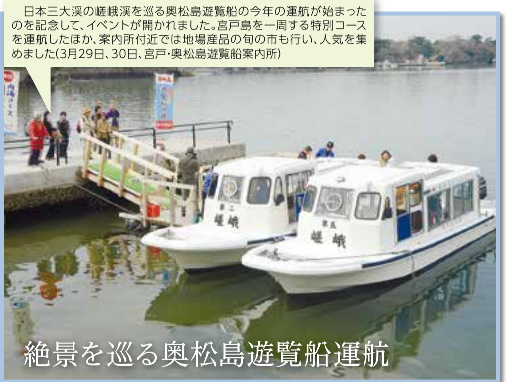
日本三大溪の嵯峨溪を巡る奥松島遊覧船の今年の運航が始まったのを記念して、イベントが開かれました。宮戸島を一周する特別コースを運航したほか、案内所付近では地場産品の旬の市も行い、人気を集めました(3月29日、30日、宮戸・奥松島遊覧船案内所)