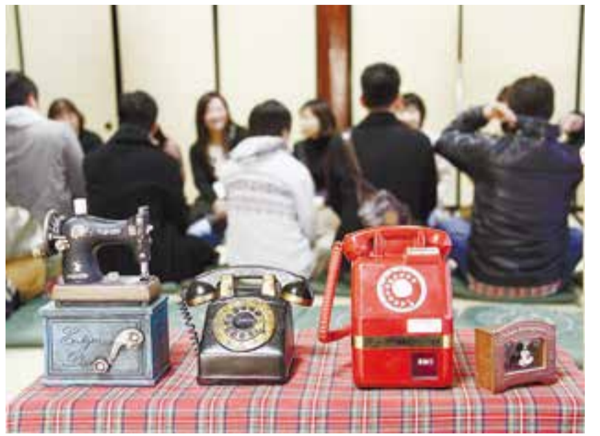
風情あふれる日本家屋を会場に「昭和レトロ・蔵コン」が開かれ、市内外から参加した男女約50人が雰囲気を楽しみました。お好み焼きやみそおでん、アルコール類などの屋台もあり、意気投合した人たちは食事をしながら会話を弾ませました(3月21日、蔵しっくパーク)