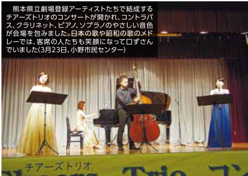
熊本県立劇場登録アーティストたちで結成するチアーズトリオのコンサートが開かれ、コントラバス、クラリネット、ピアノ、ソプラノのやさしい音色が会場を包みました。日本の歌や昭和の歌のメロデーでは、客席の人たちも笑顔になって口ずさんでいました(3月23日、小野市民センター)