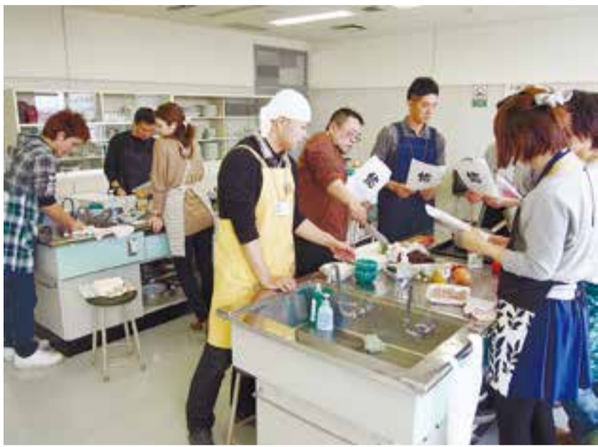
料理を学びながら交流を深める第2回COOKコンには、宮城県内の男女11人が参加しました。地元食材を使った肉料理やサラダ、魚介パスタなど協力し合って楽しく作りました(3月23日、市コミュニティセンター)