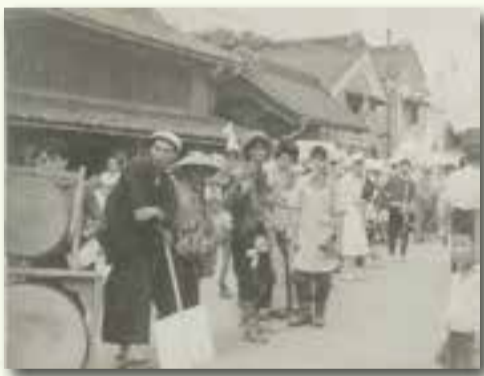
▲昭和33年航空祭「チンドン屋を見る仮装行列」

市図書館が保存する昭和30年からの航空祭の写真、ホームページで公開しています。 右の写真は昭和33年に行われた「航空祭フォトコンテスト」出展作品です。 当時の懐かしい航空祭の様子を、ご覧ください。