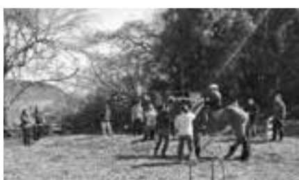
▲乗馬を体験する参加者のみなさん(美馬森JAPAN牧場予定地)

3月23日(日)に、市内野蒜地区でHOPE会員の医療法人社団KNI(北原ライフサポートクリニック東松島)による森林を使ったストレスケアイベント「ここから(心・体)一歩」プログラムが開催されました。