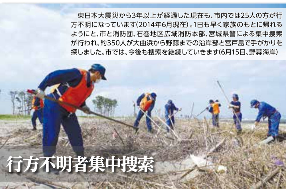
東日本大震災から3年以上が経過した現在も、市内では25の方が行方不明になっています(2014年6月現在)。1日も早く家族のもとに帰れるように、市と消防団、石巻地区広域消防本部、宮城県警による集中捜索が行われ、約350人が大曲浜から野蒜までの沿岸部と宮戸島で手がかりを探しました。市では、今後も捜索を継続していきます(6月15日、野蒜海岸)