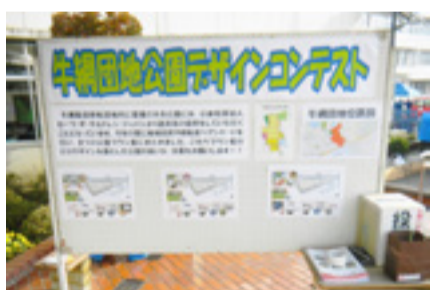
▲まつり会場にも投票箱を設置し、意向を広く把握

集団移転先である矢本西・牛網団地内の公園遊具などは、株式会社パーミリオンの協力を得た、公益社団法人セーブ・ザ・チルドレン・ジャパンの復興支援事業の一環で整備されることになりました。