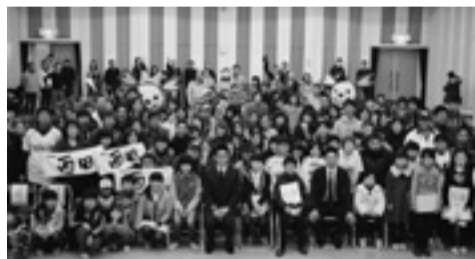
▲「楽天イーグルス西田・岩崎両選手 トークショー」

今回は、昨年12月7日(日)に小野市民センターで開催しました東松島市民フェスタ~みんなで作る環境未来都市~の報告です。