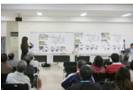
▲矢本西地区の協議会全体会議でプランを説明