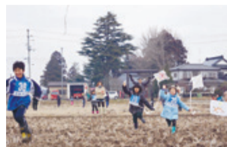
▲昨年開催の様子(2月2日)

■ 主催・問 オール赤井凧あげ大会実行委員会事務局:赤井市民センター内 ☎82-2075