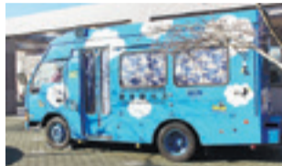
あしたの本 図書館バス

「こどもたちへ〈あしたの本〉プロジェクト」を通じて12月6日(土)・7日(日)の2日間、図書館にて開催しました。