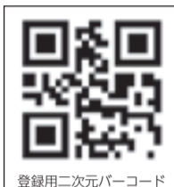
登録用二次元バーコード

※携帯電話のアドレスを登録される方でドメイン指定受信を設定されている方は、「hm-mail.jp」ドメインからのメールを受信できるように設定してください。