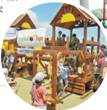
写真…新しく整備された公園には、子どもたちの笑顔と無邪気な笑い声があふれています