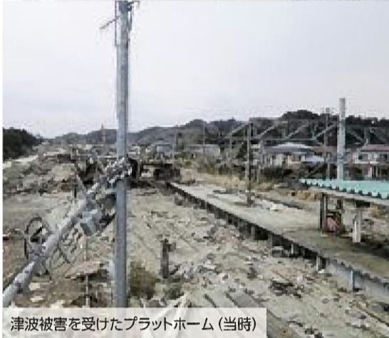
津波被害を受けたプラットフォーム(当時)