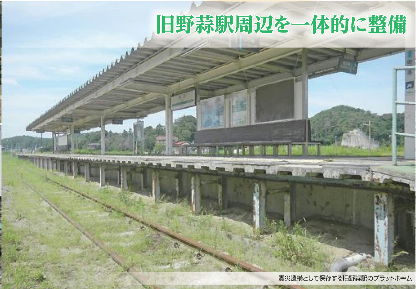
震災遺構として保存する旧野蒜駅のプラットフォーム

私 たちのまちに甚大な被害をもたらした東日本大震災からもうすぐ5年半の歳月が経過します。東松島市では震災の記憶と教訓をいつまでも風化させることなく後世に伝えるため、JR仙石線旧野蒜駅の周辺を「(仮称)震災復興メモリアルパーク」として整備する計画を進めています。ここでは、同パークを構成する旧野蒜駅プラットフォーム(震災遺構)、震災復興伝承館、祈念ひろば(メモリアル空間)の整備事業の概要を紹介します。