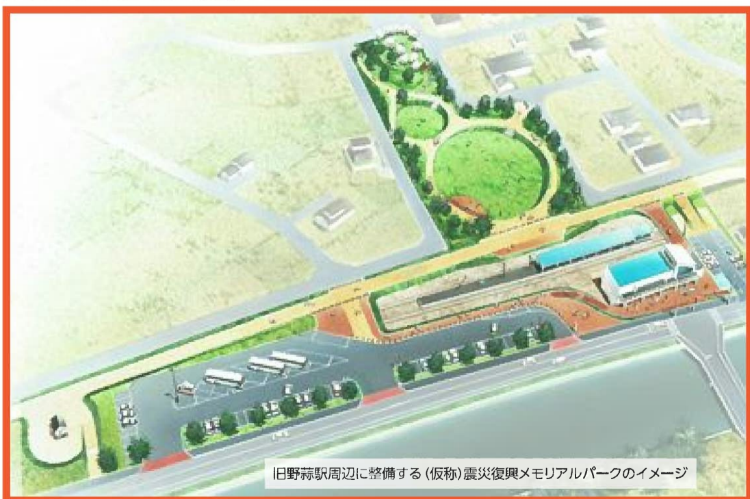
旧野蒜駅周辺に整備する(仮称)震災復興メモリアルパークのイメージ

の観光客で賑わいを見せていたJR旧野蒜駅舎。市では同駅舎を「震災復興伝承館」として改修し、震災や復興まちづくりなどに関する記録を後世に伝承するための拠点施設として整備を進めています。館内には震災に関する写真パネルの展示や映像の放映設備を備え、防災学習や修学旅行など教育旅行のコースとしての活用も期待されます。今後、本格的な改修工事を行い、10月1日の開館を予定しています。(工事期間中、一部立ち入り出来ない区域があります。)