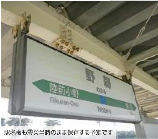
駅名板も震災当時のまま保存する予定です