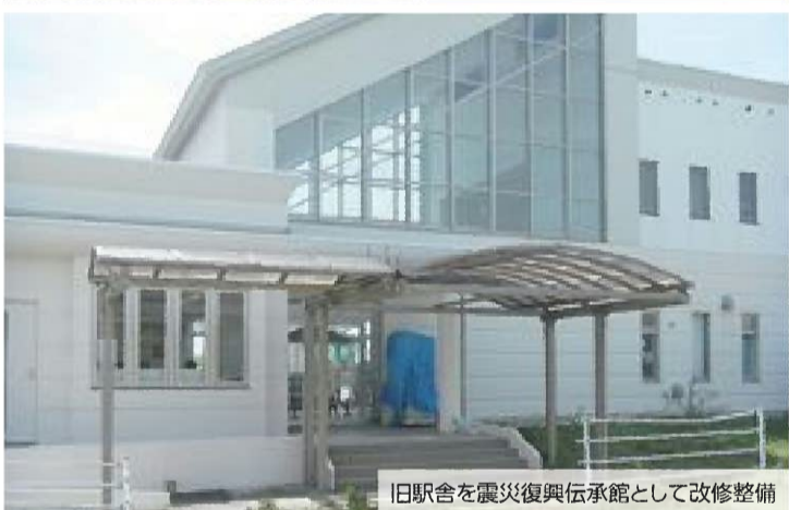
旧駅舎を震災復興伝承館として改修整備