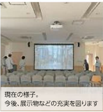
現在の様子。今後、展示物などの充実を図ります