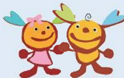
東松島市キャラクター イート&イーナ (右) (左)