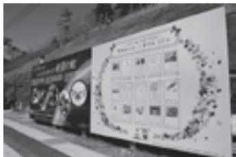
▲「環境絵日記」入賞作品は来年1月9日までJR野蒜駅前に展示しています

11月19日から、市内の小学生が未来の東松島市の姿を思い浮かべて描いた「環境絵日記」の入賞作品を紹介する看板を、JR野蒜駅前に掲示しています。この看板は、「HOPEのでんき」事業の売上金の一部を活用して製作されたものです。今後も、魅力ある東松島市のまちづくりのために、「HOPEのでんき」事業を推進していきます。