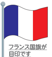
フランス国旗が目印です

※ベビー用マット完備。食べ物の持ち込み可ですので、ママ友の交流にご利用ください。