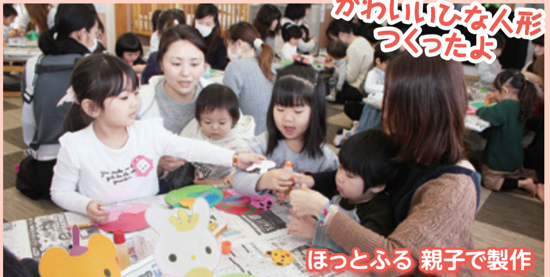
ほっとふる 親子で製作

矢本子育て支援センターほっとふるのなかよし広場「親子でひなまつり製作」には、約30組の親子が参加しました。この日は、クマのおだいり様とウサギのおひな様作りに挑戦。色紙にクレヨンで絵を描きながら世界に一つだけのひな人形を作りました。(2月14日、ほっとふる)