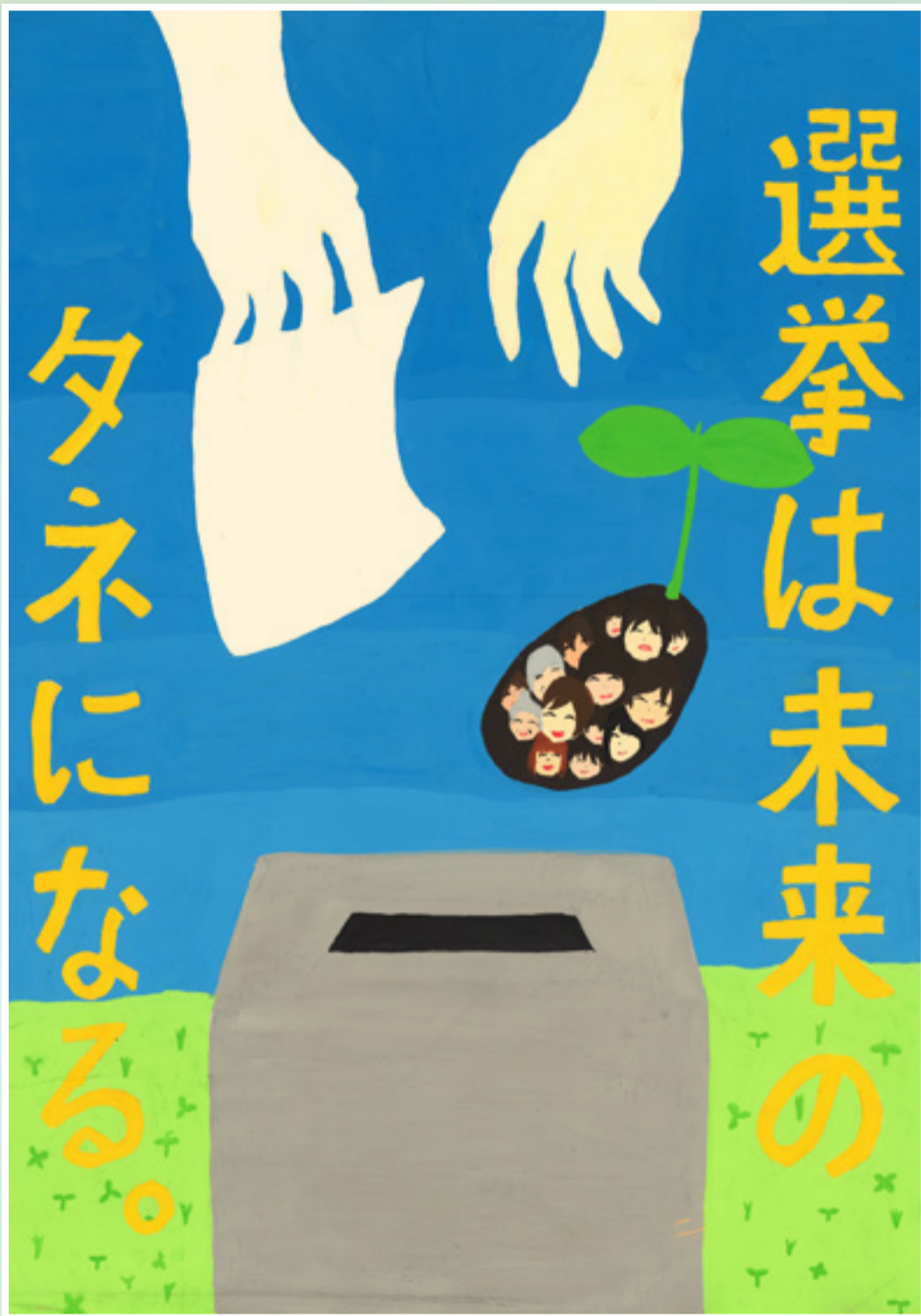
第9回 明るい選挙啓発ポスター作品