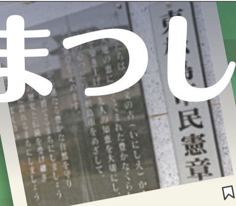
職員は毎朝、市民憲章を朗読しています。