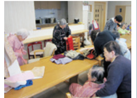
▲福祉施設での着付け体験(平成28年度実施事業)