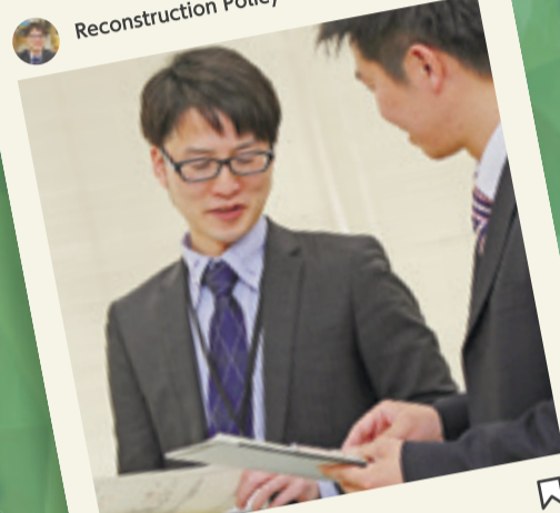
各々の仕事が忙しいなかでも、助けを求めれば手を差し伸べてくれる上司や同僚がいます。