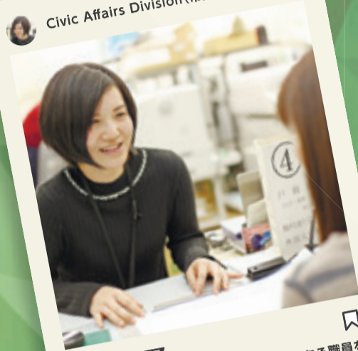
市民の皆さんが親しみやすく、頼りがいのある職員を目指しています。