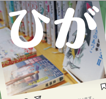
図書館は、市民の憩いの場を目指しています。