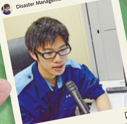
はっきりと、丁寧に、伝わりやすいように心がけています。