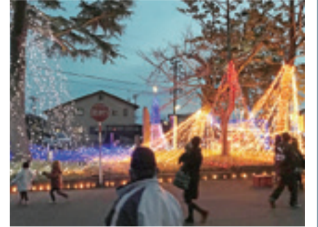
▲地域住民によるイルミネーション(平成28年度実施事業)