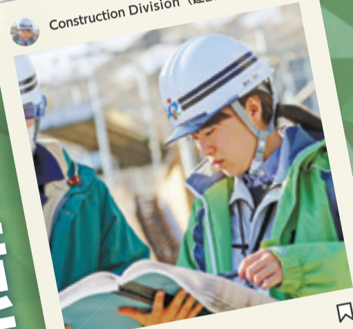
「災害に強いまちづくり」を念頭に日々の業務に取り組んでいます。