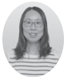
▲「息子には何でも食べる子に成長してほしい」と話す長沢さん

昨年3月に待望の第一子を授かりました。初めての出産だったので、妊娠期間中は自分が摂取する食べ物などにも気を遣いました。家族をはじめ周囲の皆さんの支えのおかげで、息子は日々すくすくと成長しています。