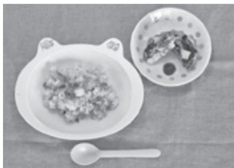
▲初めての離乳食作りはママにとってはドキドキの仕事。市の栄養士が離乳食に関するアドバイスも行っています

息子ももうすぐ1歳4か月です。だんだん自分の意思で食べ物を口に運ぶようになってきました。野菜が大好きで、特にニンジン入りの離乳食がお気に入りです。このまま好き嫌いなく、なんでも食べる子に成長してほしいです。