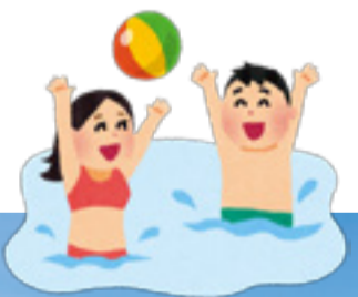
昨年の月浜海水浴場の様子