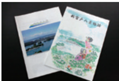
▲増刷した新宮戸八景物語