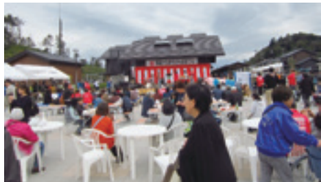
▲整備した資機材を活用したお祭りの様子