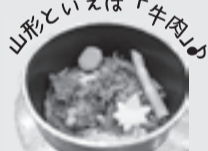
山形といえば「牛肉」