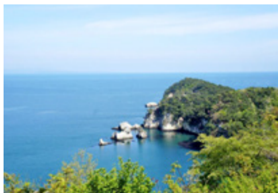
▲新宮戸八景のひとつ「唐船番所跡」からの景観