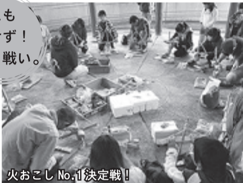
火おこし No.1 決定戦!

縄文の味を堪能する「縄文キッチン」。土器でじっくり煮込んだ「そば粥」と「シシ鍋」をお振舞い!あつたか〜い鍋に舌鼓を打ちました。