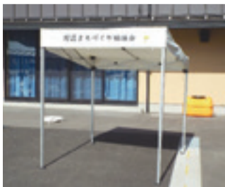
▲今回整備した備品の一部

これからも今回の宝くじの助成で整備した備品をよりよいまちづくりに大いに活用させていただきます。ありがとうございました。