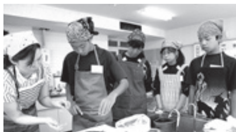
▲矢本第一中学校の4人が離乳食作りを体験しました

職場体験を通して、職員の皆さんが市民のためにさまざまな取り組みをしていることを知りました。私もできれば地域で働きたいと考えています。それに伴う資格などを取得するために今後も勉学に励んでいきたいです。