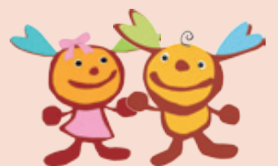
東松島市キャラクター イート&イーナ (右) (左)