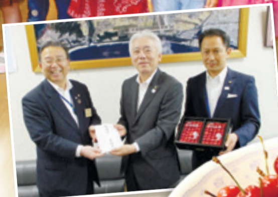
▲市役所では、東根市から義援金を贈呈いただきました。