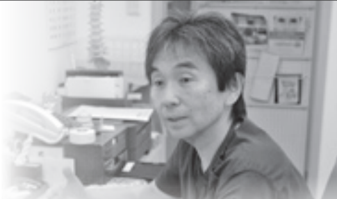
仙台ペインクリニック石巻分院