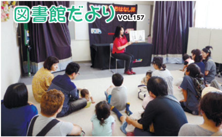
▲全国訪問おはなし隊の様子(6月3日)