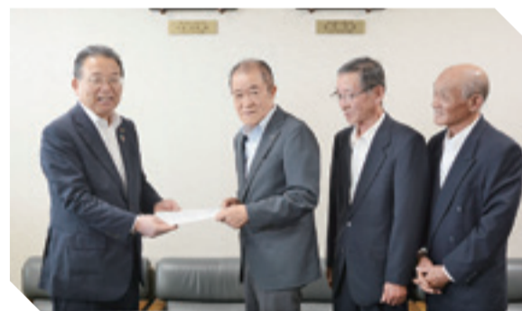
▲市に対し、旧鳴瀬未来中学校施設の跡地利用に関する要望書が手渡されました。