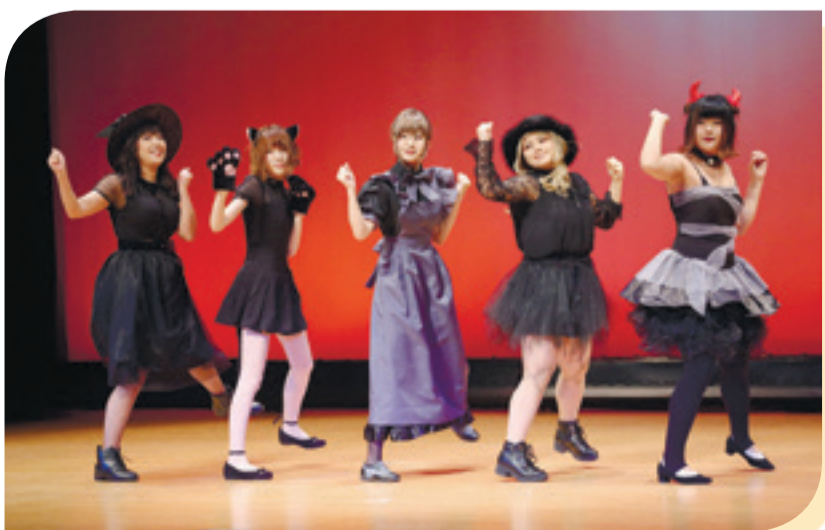
▲ 舞踊の部、日本舞踊やバレエ、創作ダンスなど28団体55演目披露