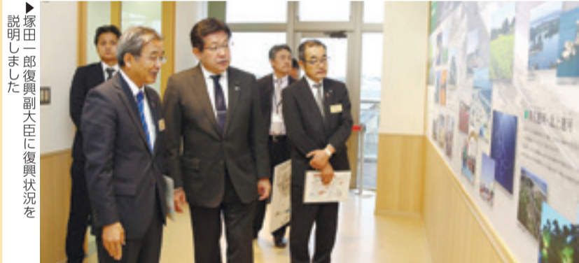
▶ 塚田一郎復興副大臣に復興状況を説明しました

10月に行われた内閣改造で、新たに就任した渡辺博道復興大臣と、橋慶一郎復興副大臣が22日に東松島市の復興状況を視察しました。渥美市長は地域復興の現状報告を行ったほか、災害時の避難経路となるJR矢本駅南北連絡通路の建設や野蒜地区の新しいスポーツ施設、排水対策などを要望しました。また26日には、塚田一郎復興副大臣も来訪し、野蒜地区の震災復興伝承館を視察。旧野蒜駅舎北側にある震災復興モニュメント前で、静かに手を合わせ、亡くなった方々の追悼と鎮魂を祈っていました。