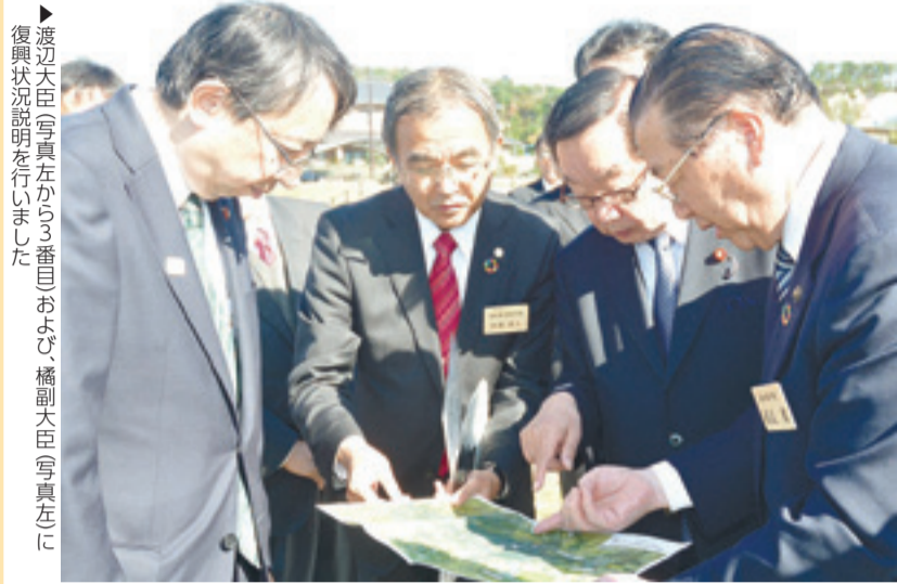
▶ 渡辺大臣(写真左から3番目)および、橋副大臣(写真左に復興状況説明を行いました)

10月に行われた内閣改造で、新たに就任した渡辺博道復興大臣と、橋慶一郎復興副大臣が22日に東松島市の復興状況を視察しました。渥美市長は地域復興の現状報告を行ったほか、災害時の避難経路となるJR矢本駅南北連絡通路の建設や野蒜地区の新しいスポーツ施設、排水対策などを要望しました。また26日には、塚田一郎復興副大臣も来訪し、野蒜地区の震災復興伝承館を視察。旧野蒜駅舎北側にある震災復興モニュメント前で、静かに手を合わせ、亡くなった方々の追悼と鎮魂を祈っていました。