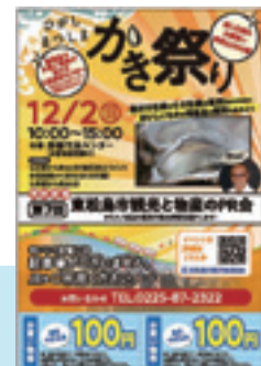
◀お買物券付き案内はがき

市内各市民センターなどに、当日会場などで使えるお買物券付き案内はがきが設置してあります。