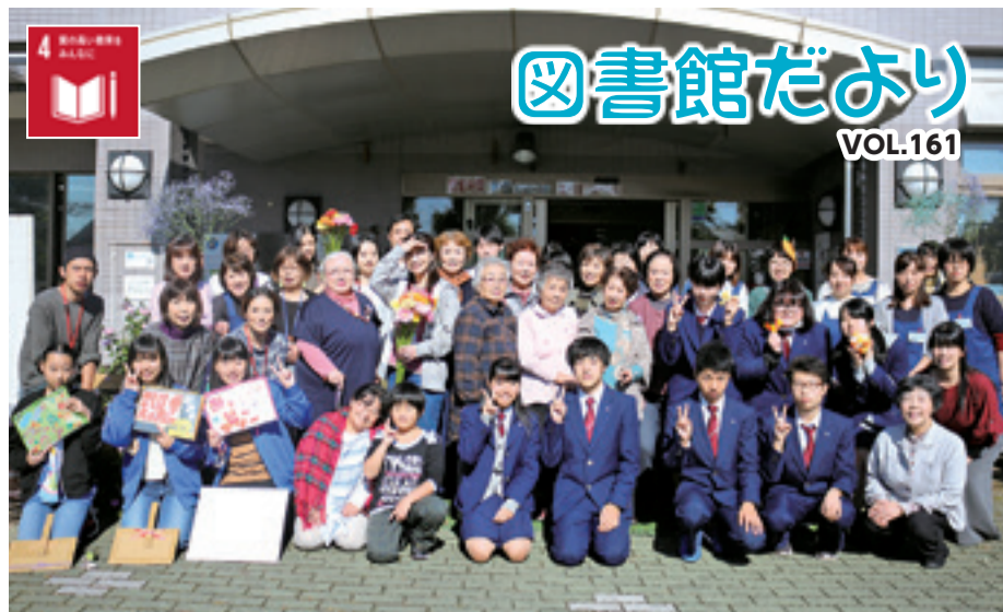
▲「図書館まつり」にご協力いただいた皆さん(10月21日)