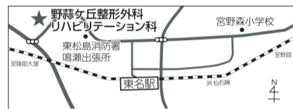
東松島市野蒜ヶ丘3丁目29-5