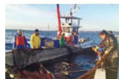
▲定置網漁の現場指導

今回2人は、バンダ・アチェ市にこれまで漁獲物の鮮度維持専門家として技術協力を行ってきた大友水産さんにて研修を行い、地元の漁師さんたちと日々作業をともにしながら、互いの漁業経験や知識を共有