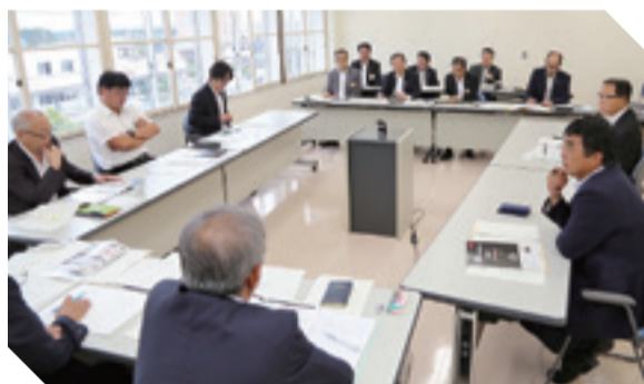
▲市議会特別委員会が開かれ、市が一丸となって誘致に取り組む必要性を説明しました。