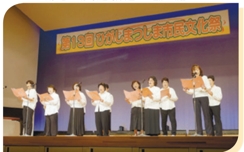
▲ 音楽の部、コーラスや歌謡、民謡など20団体が計52曲発表