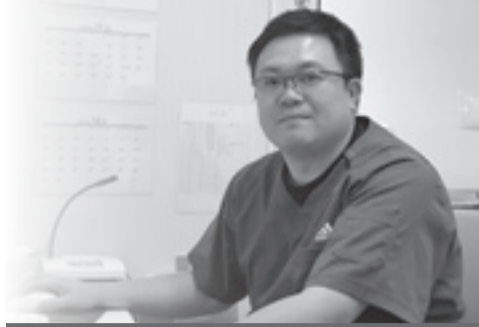
野蒜ヶ丘整形外科・リハビリテーション科