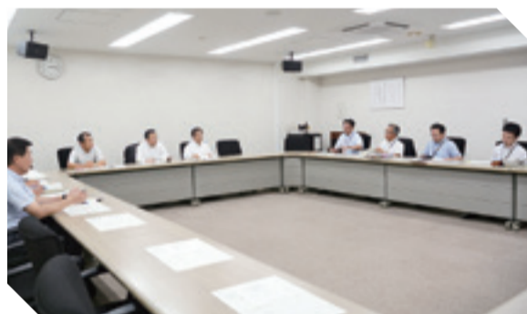
▲誘致推進チームが設置され、協定締結に向けて議論を重ねました。