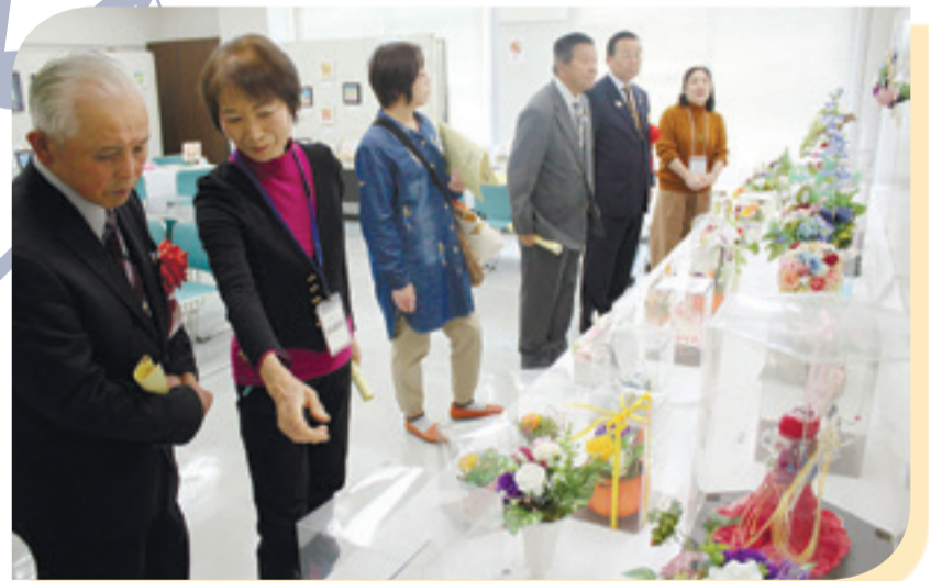
▲ 展示の部、生け花や水墨画、写真、絵画など39団体436作品が並び