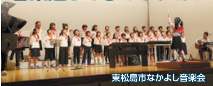
東松島市なかよし音楽会

市内11小中学校の児童生徒が発表を通して心の交流を図る「平成30年度東松島市小中学校なかよし音楽会」が開かれました。音楽会は、午前午後の二部構成で行われ、約500人の子どもたちが参加し、息の合った演奏や歌声を披露しました。(10月24日、市コミュニティセンター)