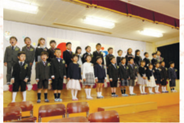
▲卒園児が歌を交えた構成詩を披露し、家族や先生に感謝を伝えながら「幼稚園の思い出をずっと忘れません」と声をそろえました。 (3月14日、矢本中央幼稚園)

令和元年度の卒業式が各幼稚園や保育所、小中学校で行われました。卒業生たちは教員や保護者の皆さんが見守る中、たくさんの思い出が詰まった学び舎を力いっぱい巣立ちました。