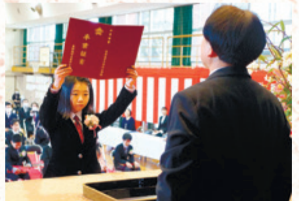
▲壇上で卒業証書を受け取った卒業生は、会場に向かって「医師になりたい」「プロ野球選手になりたい」といった将来の夢を発表しました。 (3月19日、赤井小学校)