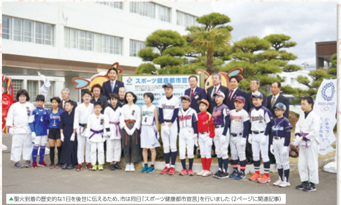
▲聖火到着の歴史的な1日後世に伝えるため、市は同日「スポーツ健康都市宣言」を行いました(2ページに関連記事)

ギリシャから東京五輪の聖火を運ぶ特別輸送機「TOKYO 2020号」が3月20日、国内で最初に東松島市の航空自衛隊松島基地に着陸しました。基地内では到着式が開かれ、ランタンの聖火を受け取った五輪3連覇の柔道の野村忠宏さんとレスリングの吉田沙保里さんが桜をモチーフにした聖火皿に点火しました。これに合わせて上空をブルーインパルスが飛び、カラーズモークで五輪のシンボルマークと同じ5色の航跡を描きました。同日の市内では官民一体のイベントが催され、矢本海浜緑地パークゴルフ場ではカラーボードで五つの輪を表現したほか、大町商店街では聖火を載せたラッピングバスを手旗で歓迎しました。この歴史的な日を記念し、将来のまちづくりにつなげるため、市役所前では「スポーツ健康都市宣言」のセレモニーが行われ、17つのスポーツ少年団代表の子どもたちを交えて銘板を除幕しました。