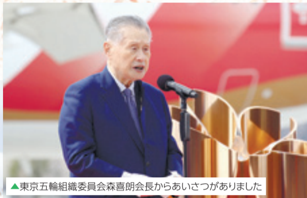
▲東京五輪組織委員会森喜朗会長からあいさつがありました