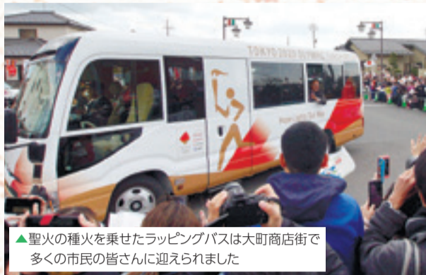
▲聖火の種火を乗せたラッピングバスは大町商店街で多くの市民の皆さんに迎えられました