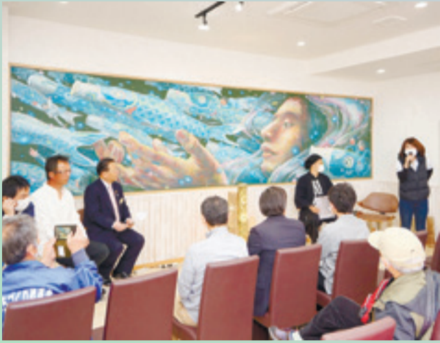
▲「狼煙上げ会」でプロジェクト成功に向けて心をつなげました。(3月28日、キボッチャ)