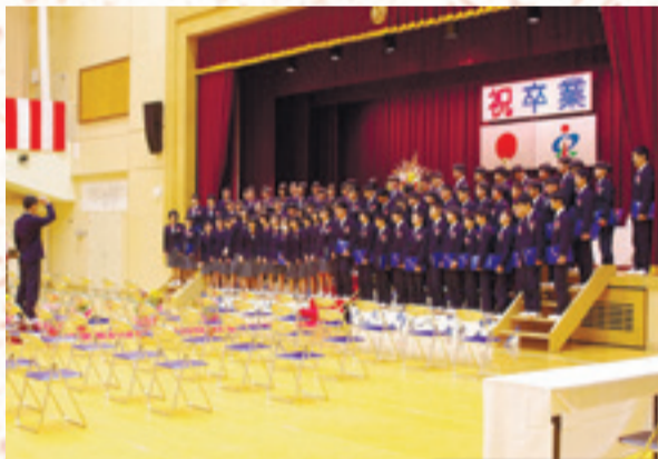
▲3年間生活を共にした仲間たち全員で思いを込めて合唱しました。 (3月6日、鳴瀬未来中学校)