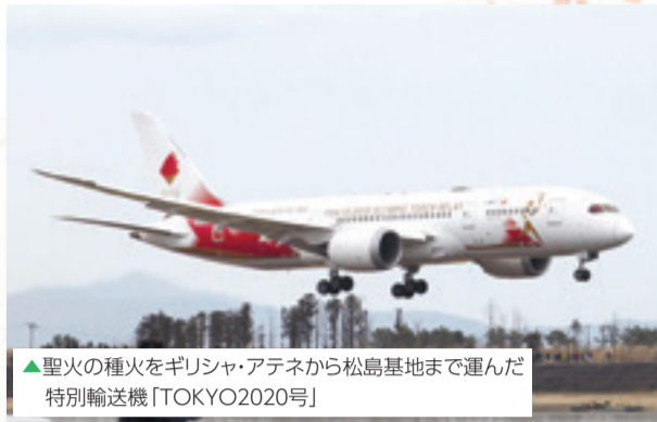
▲聖火の種火をギリシャ・アテネから松島基地まで運んだ特別輸送機「TOKYO2020号」