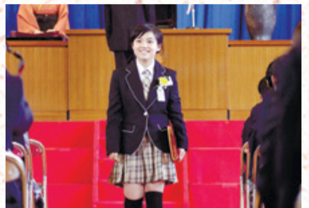
▲一人ひとり証書を手にし、壇上を下りた卒業生の表情は、進学への喜びと成長の自信に満ちあふれていました。 (3月19日、鳴瀬桜華小学校)