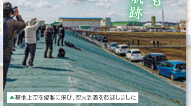
▲基地上空を優雅に飛び、聖火到着を歓迎しました