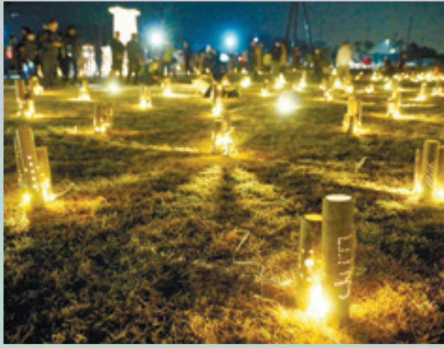
▲イベントで竹灯籠がともされました。(3月19日、震災復興祈念公園)

全国一斉に竹明かりともす「みんなの想火プロジェクト」が動き出しました。東京五輪に合わせて世界にメッセージを発信する試みで、宮城県内での準備に向けた「狼煙上げ会」は渥美市長をはじめ多くの市民の皆さんが集まりました。五輪開催は来年に延長になりましたが、開催前日の竹明かり点灯を予定しています。