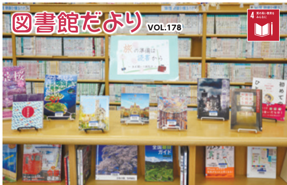
▲「本を開いて旅気分」コーナー展開中