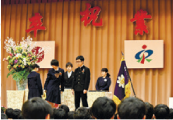
▲学校長から卒業生一人ひとりに卒業証書が手渡されました。 (3月6日、矢本第一中学校)

「CityView!」では、市のイベントや地域的话题を、皆さんにお届けします。 <掲載した写真は、データで提供します。希望の方は問い合わせください。>