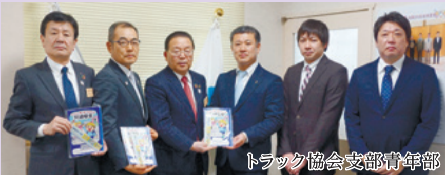
トラック協会支部青年部

県トラック協会石巻支部青年部は、4月から小学校に入学する全児童に自由帳と定規の文具セットを贈りました。交通安全を願った取り組みであり、鉄くずを資源回収し、収益金で購入しました。寄贈は石巻地方の全入学児童を対象としており、市には400セットが届けられました。(3月26日、市役所)