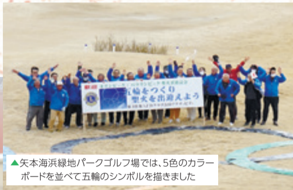
▲矢本海浜緑地パークゴルフ場では、5色のカラーボードを並べて五輪のシンボルを描きました