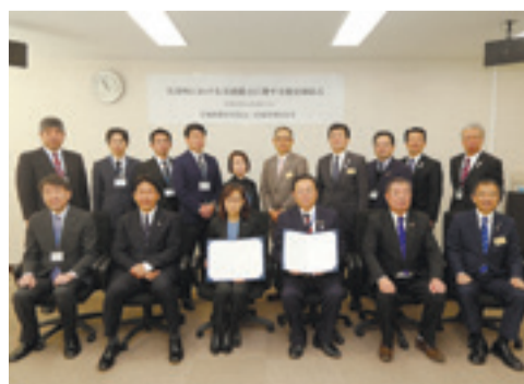
▲宮城県教育委員会