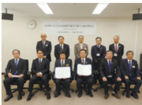
▲石巻地区森林組合