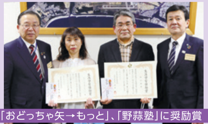
「おどっちゃん→もっと」、「野蒜塾」に奨励賞

本市の生涯学習の推進と発展に貢献した団体を讃える今年の「生涯学習奨励賞」は、よさこいチーム「おどっちゃん→もっと」と、地元文化遺産の重要性を伝える「野蒜塾」の2団体が選ばれました。本来は生涯学習大会で表彰する予定でしたが、新型コロナウイルスの影響で中止となり、市役所応接室で表彰状のみ受け渡しが行われました。(3月17日)