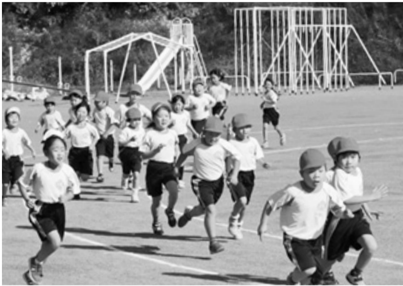
宮野森小学校の授業風景

新しい学校、新しい教室に向かう子どもたち。一人ひとりの胸に、期待や不安などが混ざり合った気持ちでいることでしょう。ここからが新しいスタートです。今年頑張りたいこと、やってみたいこと、挑戦してみたいことなどもきつと見つかると思います。ぜひ、家庭でお子さんと話をしてみてください。