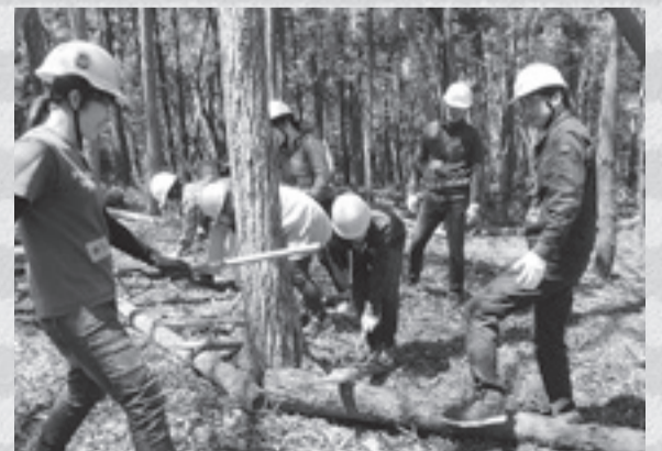
▲森というフィールドを存分に使った各種体験が特長です