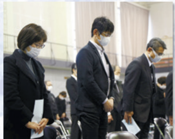
▲防災時刻に合わせて黙とうを捧げました