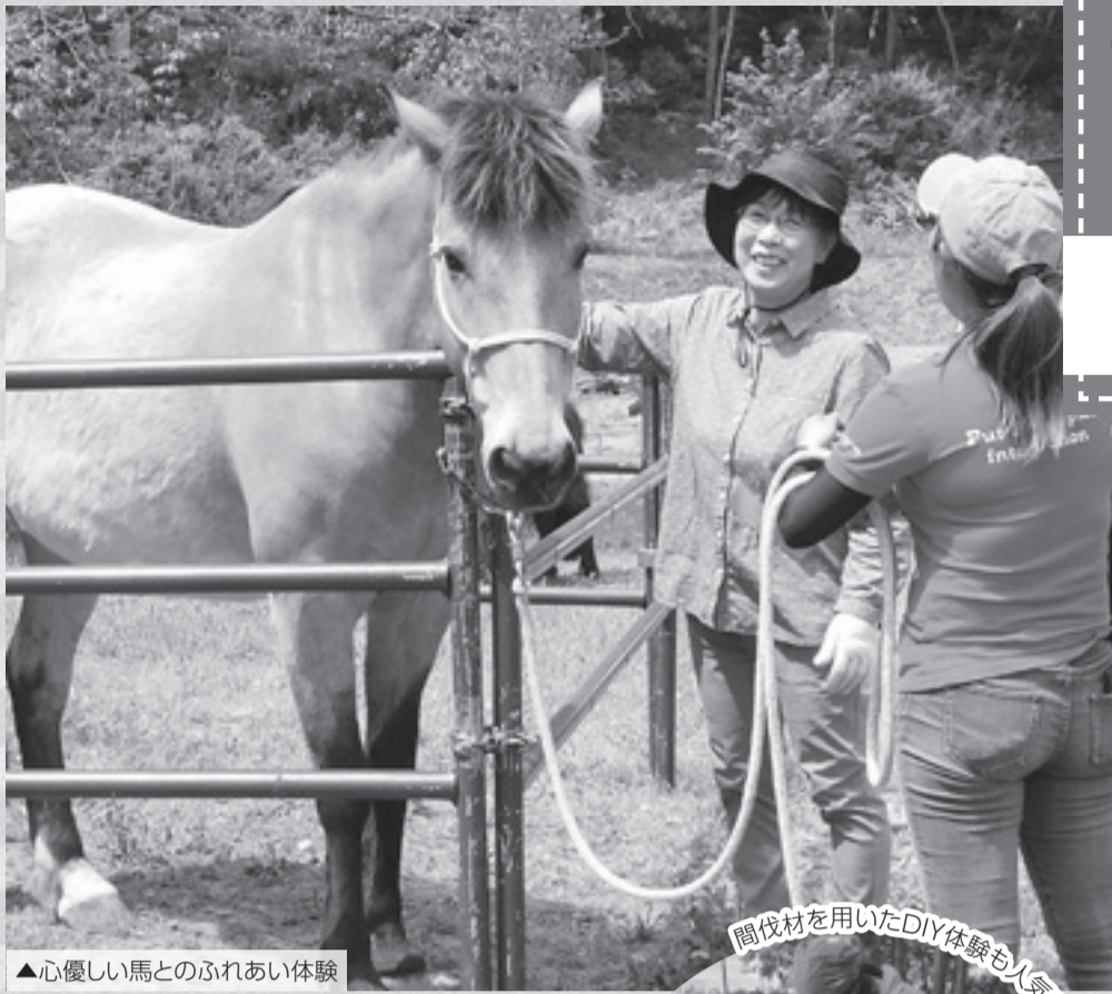
▲心優しい馬とのふれあい体験