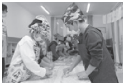
▲おやつ作りに励む園児たち

毎日の「食」を支えてくれる調理員と顔の見える関係を構築することで、園児たちの食に対する興味関心も深まるものと考えます。食べることは健康に直結し、特に幼児期の成長には大きな影響を与えるので、今後も継続して取り組んでいきたいです。