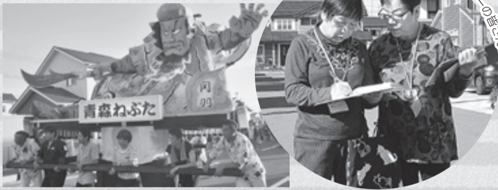
▲あおい地区夏祭りの様子