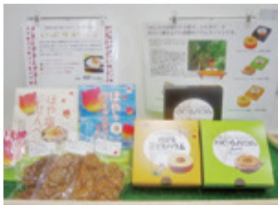
▲のびるパウムをはじめとしたお菓子も豊富に揃っています

野菜を中心とした直売所ですが、地域の皆さんからの声を受けてお菓子やさまざまな加工品も店頭と並んでいます。