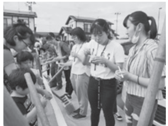
▲高校生カフェの様子

自身が自分の足で見回るので、どの家庭がどんな状況下にあるのかを把握することも容易ですし、迅速な対応も図ることができます。これも矢本運動公園の仮設住宅に身を寄せていたころから、住民同士のコミュニケーションを密に取っていたからこそできる活動だと自負しています」と話していました。