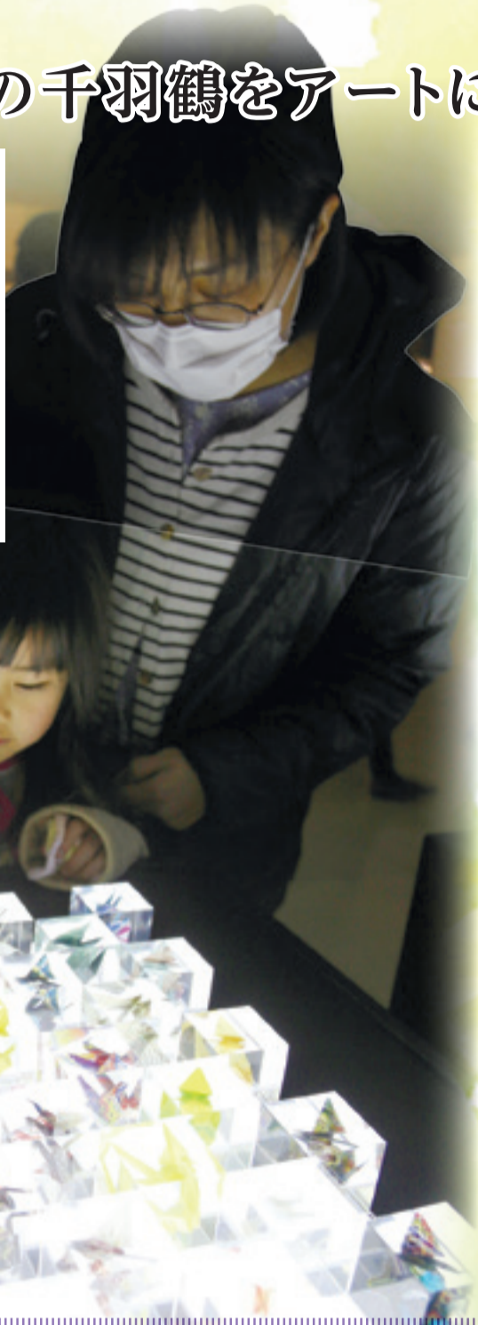
▶全国から届けられた千羽鶴が封入されたアート作品