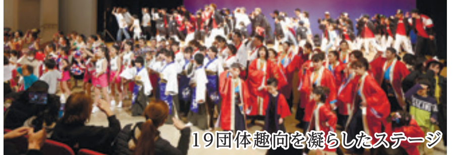
19団体趣向を凝らしたステージ

「東松島ダンスフェスティバル2020」(同実行委主催)には地元のキッズダンスのスクールやサークルなど19団体が出演し、趣向を凝らしたステージを繰り広げました。