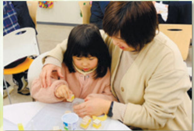
◀アート作品制作は、市民の皆さんも携わりました