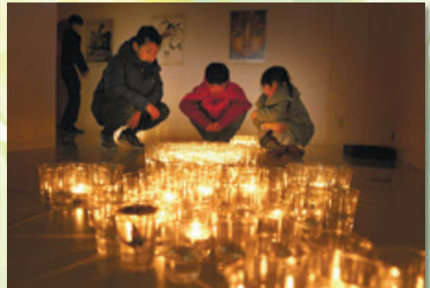
◀多くのキャンドルが並べられ、優しい光を放っていました