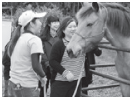
▶馬は、人の表情や声の調子からその人の心情を察する力を持っています

八丸代表は「心の復興において、ただ人の心を癒すだけでは足りないと感じています。日常生活をいきいきと過ごすためには、皆さん自身に『やりがい』や『達成感』を感じていただく必要があります。豊かな自然環境の中で、五感を刺激しながら心身の充実が図れるよう、皆さんとともに歩んでいきたいと思えます」と語っていました。