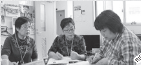
◀各世帯の状況をまとめ、サポーター間で共有しています