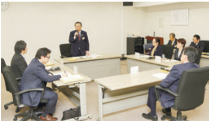
新型コロナウイルス対策中心に総合教育会議

本年度2回目の東松島市総合教育会議では、教育委員の皆さんが集い、新型コロナウイルス感染症対策や小中学校の臨時休業中の各種対応を話し合いました。児童生徒の学習に支障が出ないよう、連携して、臨機応変にきめ細かい対応をしていくことを申し合わせました。(3月17日、市役所)