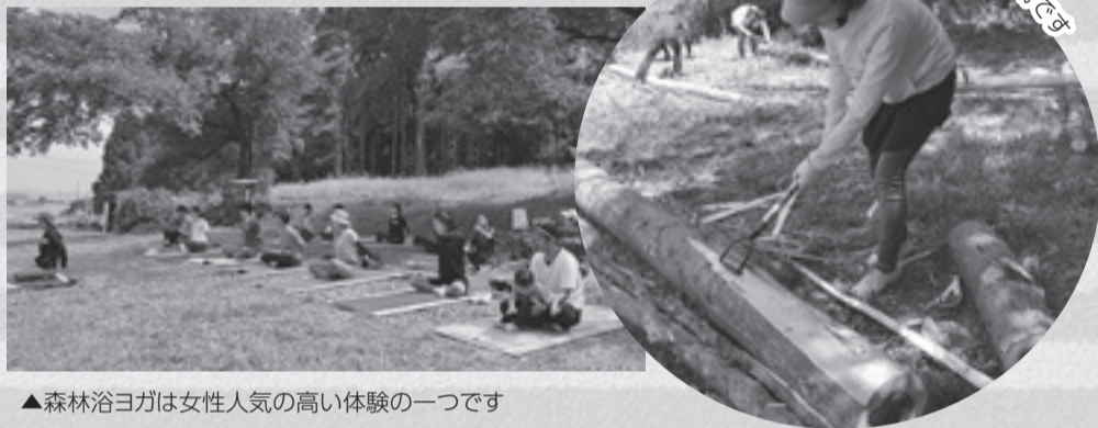
▲森林浴ヨガは女性人気の高い体験の一つです