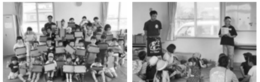
▲南浦宿舎自治会サマーレクリエーションの様子

交付対象事業は地域が行う行事で子どもが主体的に参加するものとなり、地域行事の一助となります。また、青少年などの健全な育成に資するものは助成対象となりますので申し込みください。なお、交付申請書は各地域の市民会議地区自治会推進員となりますが、詳しい内容は下記に問い合わせください。