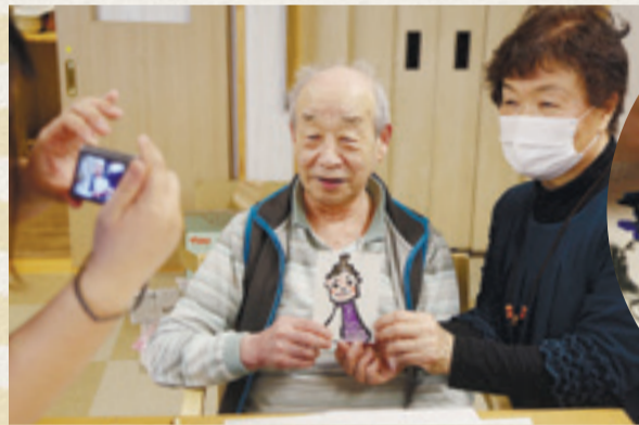
▲完成した絵手紙とともに記念撮影をするのも楽しみの一つです