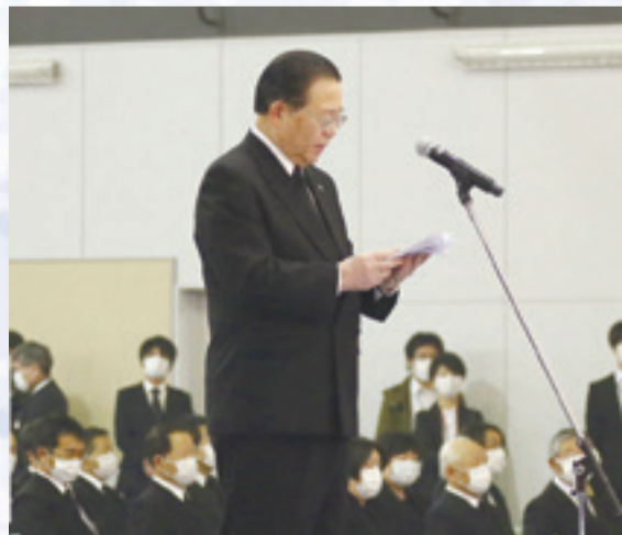
▲渥美市長は震災を語り継ぐことを式辞で述べました