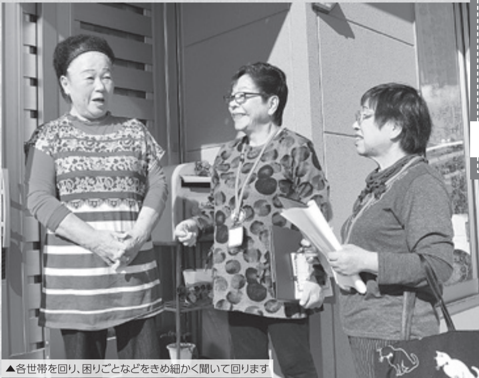
▲各世帯を回り、困りごとなどをきめ細かく聞いて回ります

地区会は震災復興の数々の先進的な取り組みが高く評価され、「第14回住まいのまちなみコンクール」（一般財団法人住宅生産振興財団など主催）で、「住まいのまちなみ賞」に選出されています。特徴的なのは行政やNPOに頼らず自立的な活動を行っていることで、そのもっとも顕著な活動が住民の「見守り活動」です。