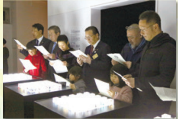
◀お披露目式が開催されました