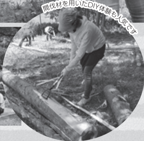
間伐材を用いたDIY体験も人気です