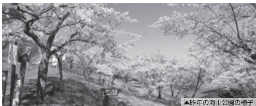
▲昨年の滝山公園の様子

滝山公園は市のほぼ中央に位置する市内随一の桜の名所です。4月中旬にはソメイヨシノ、下旬には八重桜が咲き誇り、お花見を楽しむ市民の憩いの場として多くの市民の皆さんで賑わいます。