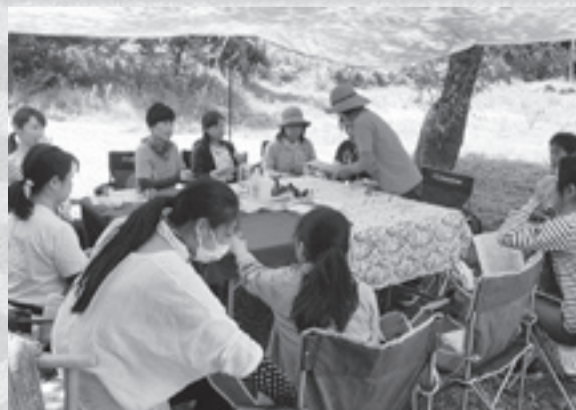
▲参加者同士の交流も育まれています