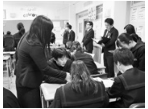
矢本第一中学校の授業風景

子ども一人ひとりがさまざまなおもいを抱えています。その「気持ち」や「思い」に耳を傾けながら温かく受け止め、寄り添い、良いことは褒め、間違っている時には、毅然と正してあげることも大切です。そのような関わりを通して、他を思いやる心の美しさ、尊さを学び、時に我慢することの必要性を感じとることでしょう。スマホやゲーム、テレビなどの時間を家庭で決め、家族での会話の時間を大切にして欲しいと思います。