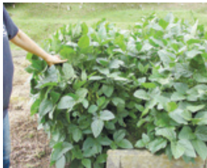
▲実をつけ順調に成長している枝豆

枝豆は、豆と野菜の栄養素を含んだ緑黄色野菜。エネルギー、脂質、良質なたんぱく質に富み、ビタミン類、食物繊維、カルシウムなども含んでいます。昔から栄養不足解消、疲労回復に効果があるとされています。一袋の価格は200円になりますので、ぜひ購入ください。