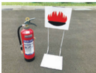
▲▶今回購入した防災用資機材の一例