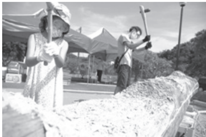
3年後を目指して!丸木舟作り