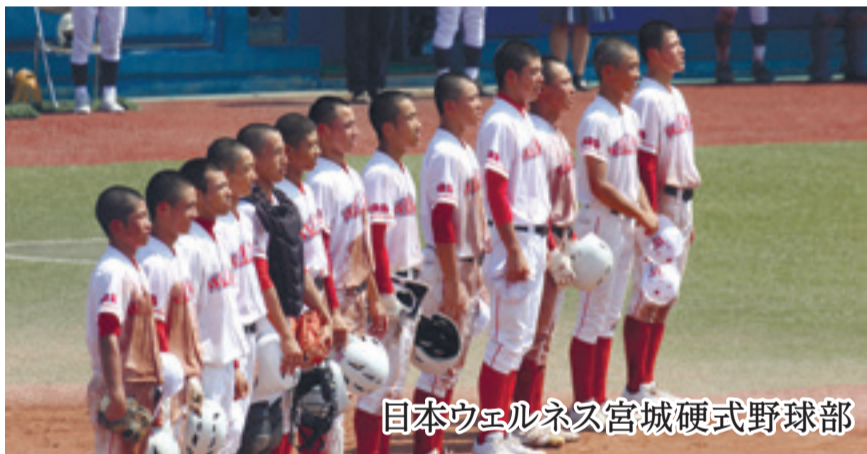
日本ウェルネス宮城硬式野球部