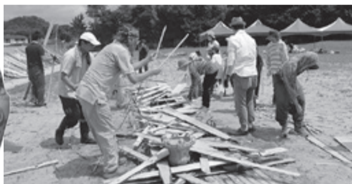
今年は慎重に...野焼き