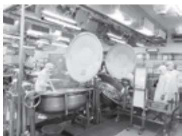
▲市内小中学校用の給食を調理するフロア

給食を通じて市内にはおいしいものがいっぱいあることを知って、心身共に健全に成長してくれればと思います。