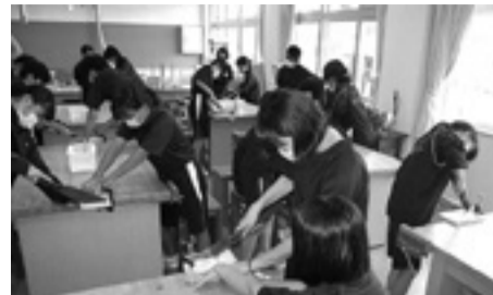
協力してのこぎりの使い方を学ぶ様子

そのほか、漢字検定や英語検定、数学検定をはじめとした各種検定への積極的な取り組み、定期考査前の放課後学習会の実施、学習習慣の確立を目指した毎日の家庭学習などにより、学習意欲の向上を目指しています。