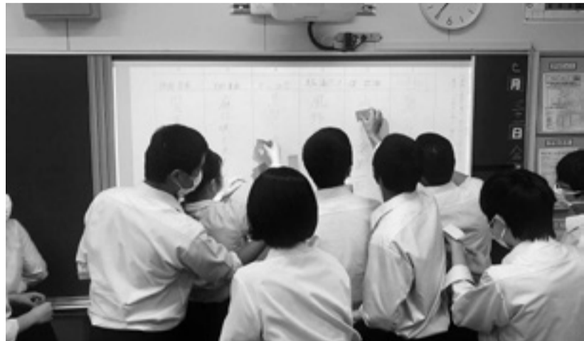
プロジェクターで俳句の鑑賞会を行う様子

また、授業での「学び合い」を大切に、問題解決に向けて協力して取り組む中で、生徒がお互いを認め、励まし合うことができる授業を目指しています。