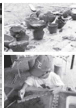
カラムシの糸作り