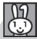
証明写真 (6か月以内に 撮影したもの)