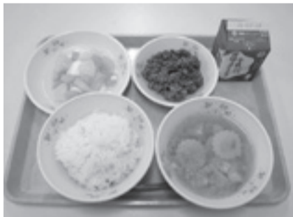
▲もりもり頬張る姿を想像し、愛情を込めておいしい給食づくりに取り組んでいます

給食は日々の学校生活における一番の楽しみという児童生徒も少なくないと思います。私も学生時代は給食が楽しみで、多くの人を喜ばせたいと管理栄養士の資格を取りました。