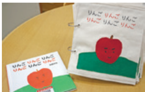
「りんごりんごりんごりんごりんごりんご」安西水丸

布えほんボランティア「フェルト」が新しい布絵本を製作しました。布のやわらかい手触りとフェルトのぬくもりあるデザインになっています。貸出をしていますので、ぜひ手に取ってみてください。