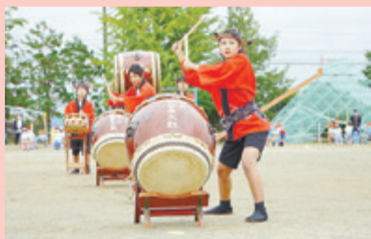
赤井小学校運動会