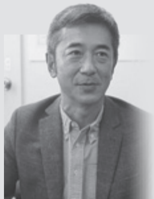
食品流通・商品開発