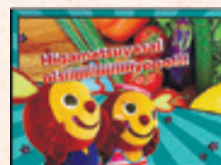
▲オリジナルマグネット