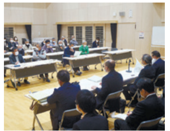
▲大曲地域市政懇談会