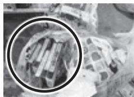
▲ビデオテープが 混ざったもの