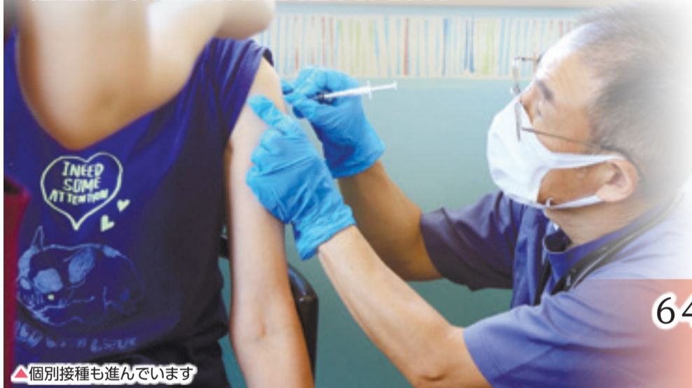
▲個別接種も進んでいます

8月2日からは一般の64歳以下の方もかかりつけ医で個別接種を受けています。8月22日(日)からは、市内3市民センターを会場とした集団接種もスタート。市内の中学生についても保護者とともに個別または集団で接種を行うことができます。国のワクチン配給量が不透明のため、34歳以下については接種予約を現在停止(変更の場合あり)していますが、国や県への要望を続け、市全体の接種完了時期に遅れがなく、早めていけるよう務めていきます。