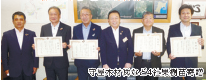
守屋木材(株)など4社果樹苗寄贈

野蒜地区の被災元地を活用して整備中の「令和の果樹の花里づくり構想」で、梅などの果樹苗木計280本を寄附した守屋木材(株)など4社に渥美市長が感謝状を贈りました。同社のほか、日鉄セメント、(株)仙台木材市場、守屋運輸(株)から、4種類の梅260本、あんず20本を寄贈いただき3月に植樹。概ね順調な生育を見せています。(7月26日、市役所)