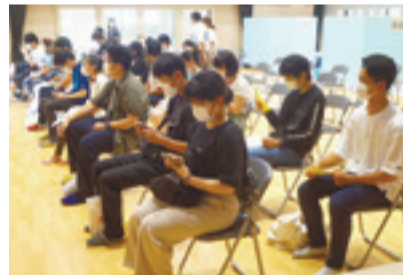
▲接種後は15分待機してから帰宅