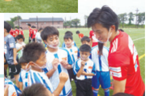
▶手話の指導もあり、子どもたちが挑戦

デフ(聴覚障害者)サッカー日本代表選手団が本市で合宿(7月22～24日)を行うのに合わせ、地元の東松島サッカークラブや県内の聴覚障害児童を招いたサッカー教室を開きました。練習前に手話でのコミュニケーションを学び、手話を活用した仲間集めや鬼ごっこ形式の軽運動を通じて親ばくと障害の理解を深めていました。