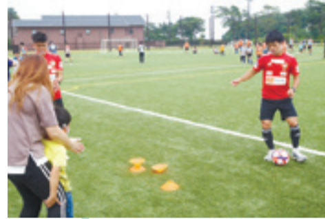
◀代表選手とボールを使った交流もありました