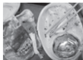
▲汚れがひどいもの 割ればし

※上記のものは「可燃ごみ」として処理してください。なお、不明な点は下 記に問い合わせください。