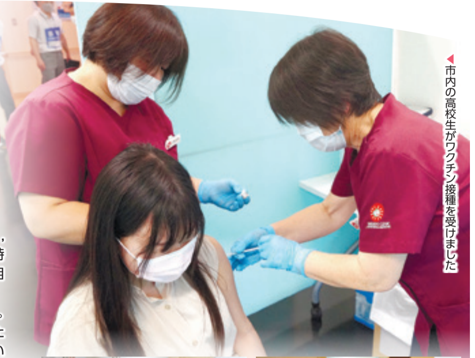
▲市内の高校生がワクチン接種を受けました