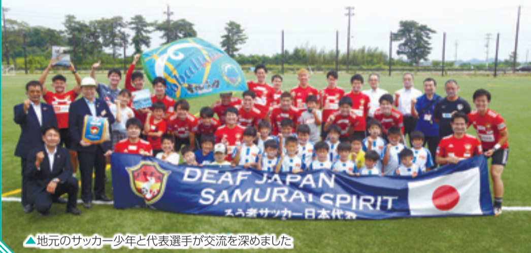
▲地元のサッカー少年と代表選手が交流を深めました