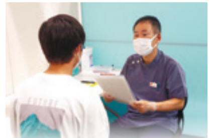
▲医師の問診で健康状態を確認