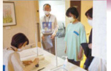
▲保護者とともに受付を行いました