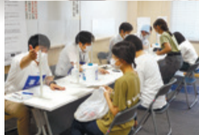
▲市職員が予診票をチェックしました