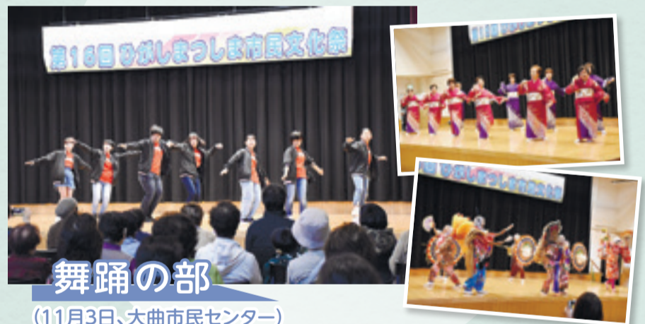
舞踊の部 (11月3日、大曲市民センター)