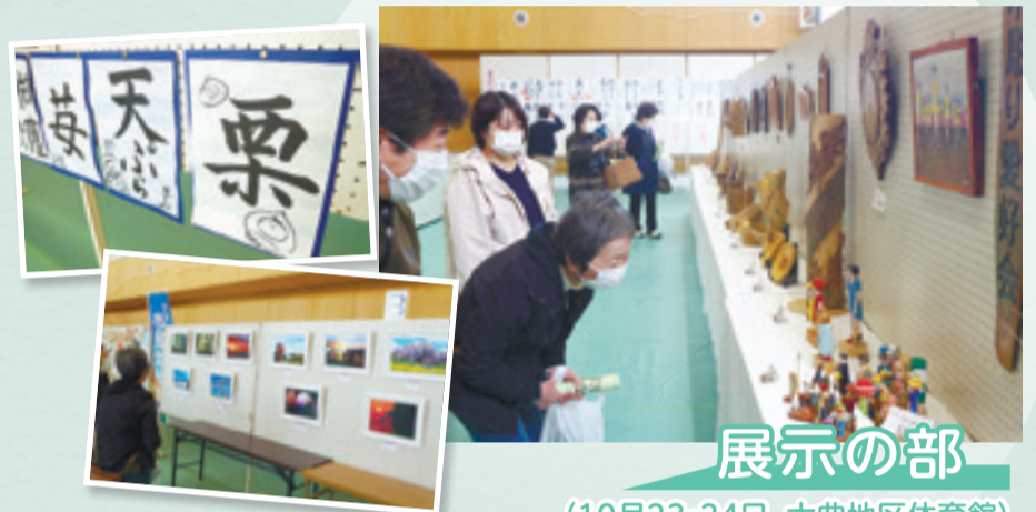
展示の部 (10月23・24日、大曲地区体育館)

今年は「今こそ文化でつなぐ笑顔の輪」をキャッチフレーズに、展示、音楽、舞踊の3部門でコロナ禍の難しい状況でも芸術文化の持つ力で市民に笑顔を届けようと開催。例年会場となっていた市コミュニティセンターが大規模改修工事中であるため、近隣の大曲地区体育館と大曲市民センターを代替会場に実施となりました。このうち展示の部では、1千点近い写真や彫刻、書、山野草など市民の手がけた感性豊かな作品が並びました。子どもたちがしたためた書、ブルーインパルスを収めた写真、こだわりが感じられる彫刻作品や生け花、各種アート作品などを眺めていました。