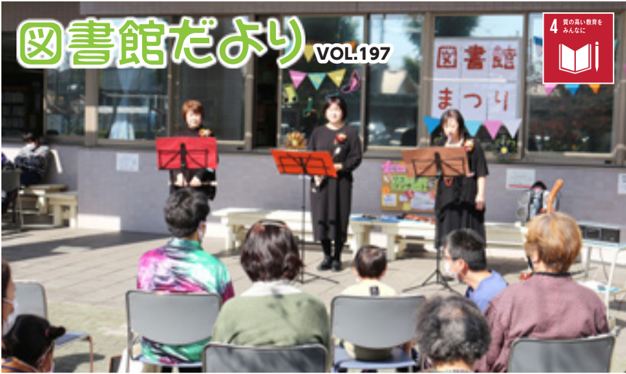
▲「図書館まつり風景」(10月24日)