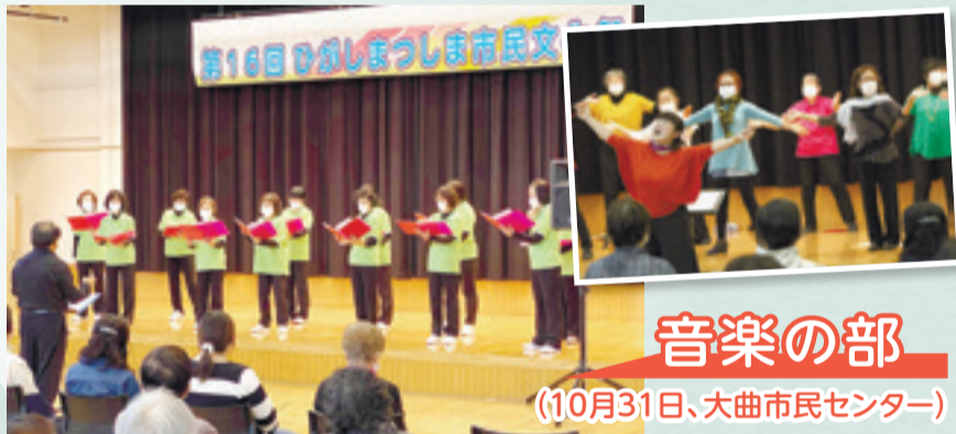
音楽の部 (10月31日、大曲市民センター)