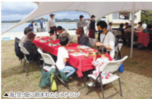
▲海・空・畑に囲まれたレストラン