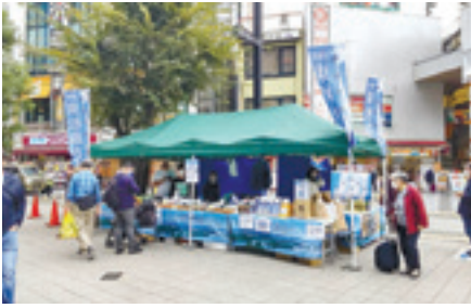
(10月14日、15日、東京都大田区)

東松島市では、6つの都市と友好姉妹都市・友好都市の提携を行っており、一層の友好と親善を深め、産業と文化の交流を図っています。3年ぶりに各都市のイベントに参加し、特産品販売や観光PRを行いました。また、令和4年4月15日に新たに友好都市となった蔵王町で開催された蔵王町産業まつりにも初めて参加し、交流を深めてきました。