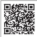
ひきこもり ボイス ステーション

また、ひきこもり相談は市でも随時受け付けていますので、問い合わせ先まで連絡ください。