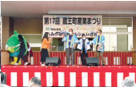
(10月22日、23日、宮城県蔵王町)