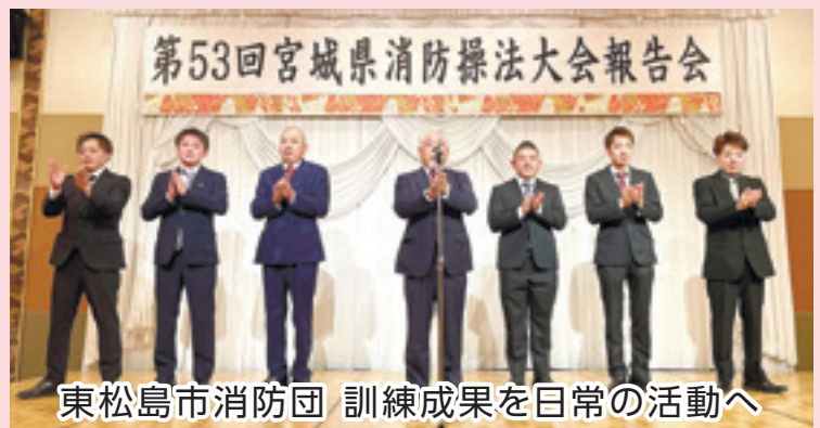
東松島市消防団 訓練成果を日常の活動へ

矢本西地区の日「エンジョイウエスト」が開かれました。地域のレクリエーション大会であり、矢本西小の校庭を使って8つの種目に挑戦。防災訓練を兼ねた種目から始まり、誰もが楽しめる軽運動で交流。矢本西小の5、6年生は鼓笛隊演奏を披露しました。最後は大抽選会で盛り上がりました。(10月16日)