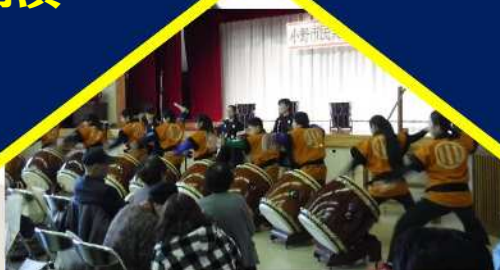
オープニング：鳴瀬鼓心太鼓