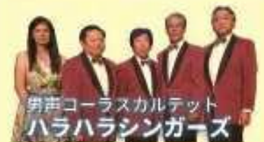
男声コーラスカルテット ハラハラシンガーズ