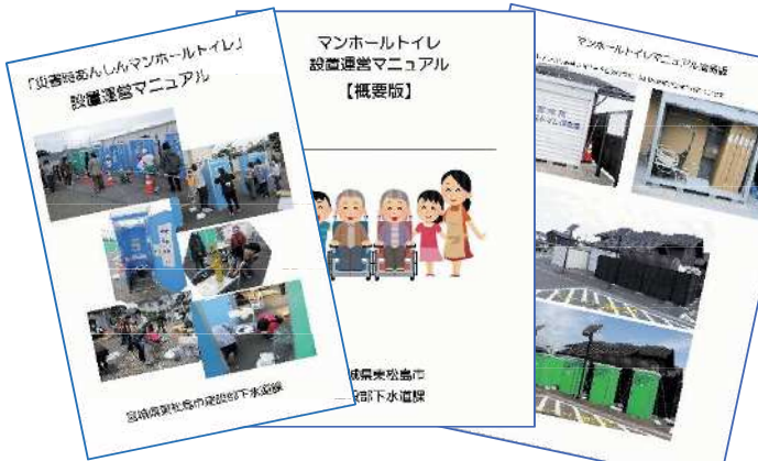
「設置運営マニュアル」・「概要版」・「簡易版」

これまで、お祭りや運動会において設置運営訓練を行ってきましたが、今後は防災訓練や発災時での自主運営を目指すため、市民に分かりやすいマニュアルを産学官連携により3編に編集し動画も作成しました。