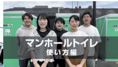
宮教大ゼミ生の協力による動画