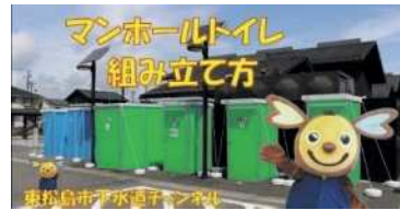
YouTube東松島市下水道チャンネル