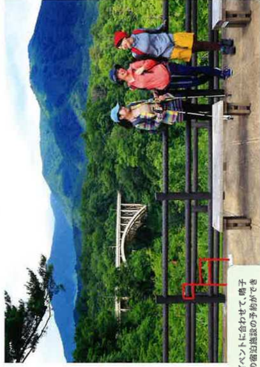
オルレイベントに合わせて、鳴子 温泉駅の宿泊施設の予約ができ ますので、お問い合わせください。

問合せ・申込先 (一社)みやぎ大崎観光公社 電話:0229-25-9620(平日のみ)