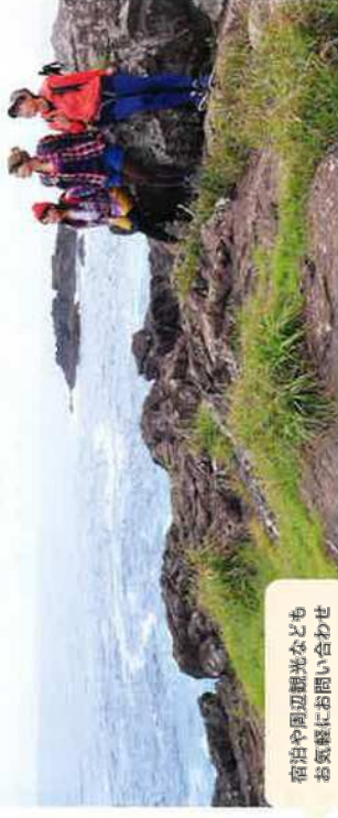
宿台や周辺観光なども お気軽にお問い合わせ ください。