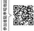
参加者駐車場地図