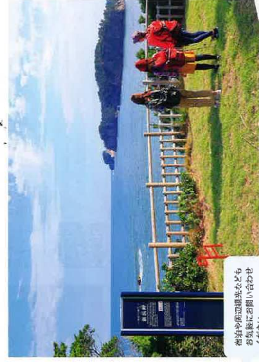
宿台や周辺観光なども お気軽にお問い合わせ ください。

問合せ・申込先 (株)東松島観光物産公社 電話:0225-86-1511 FAX:0225-86-1545