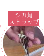
シカ角 ストラップ