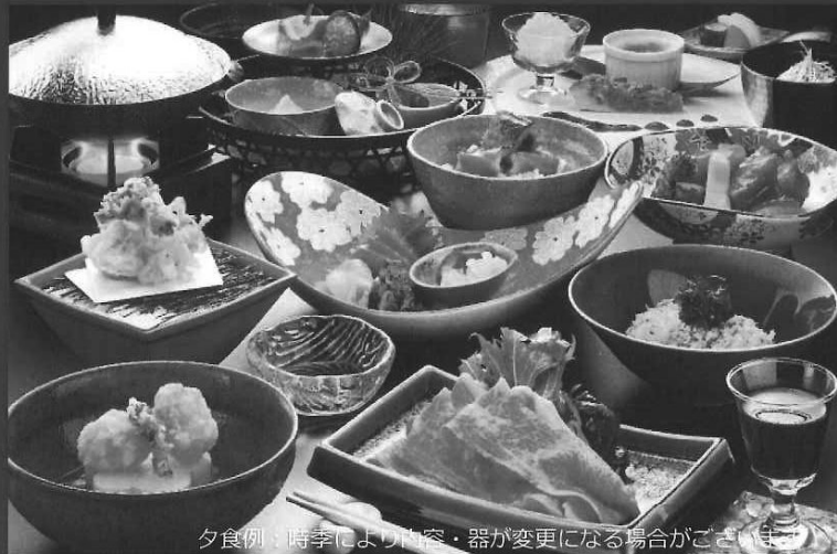
夕食例：時季により内容・器が変更になる場合がございます