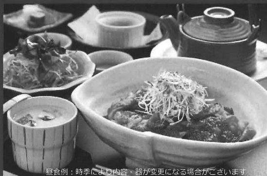
昼食例：時季により内容・器が変更になる場合がございます