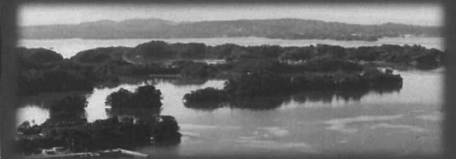
松島四大観・大高森(杜観)からの眺め。はるか南方には蔵王連邦が望めます。