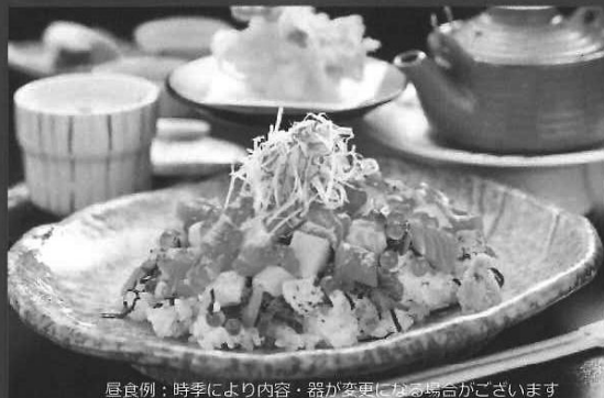
昼食例：時季により内容・器が変更になる場合がございます