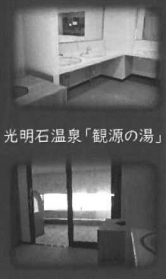
光明石温泉「観源の湯」