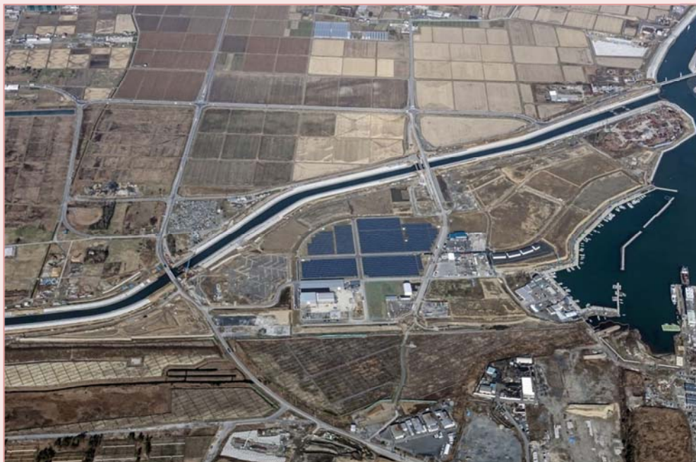
【平成29年11月27日に撮影した大曲浜地区】