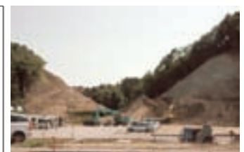
仙石線復旧工事の様子<その③>