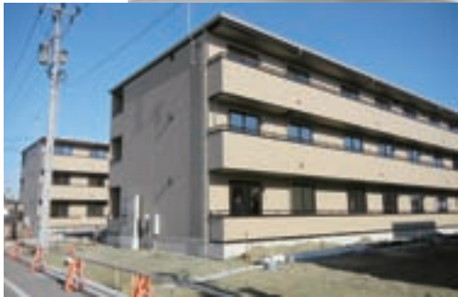
市営小松南住宅(小松谷地地区)