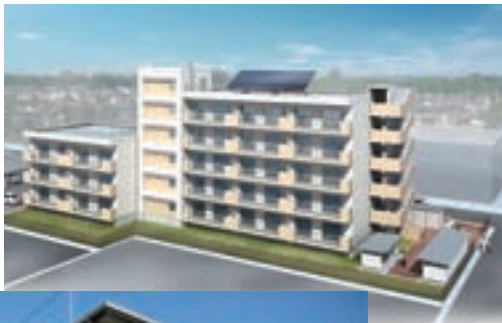
市営小野中央住宅(鳴瀬給食センター跡地)

間取り欄に数字が入っているものは整備戸数が決まっている地区、○の欄は整備するタイプがあるもの、×の欄は整備するタイプがないもの。 ※地区内のエリアにより完成時期が異なることから、完成次第順次の入居となります。