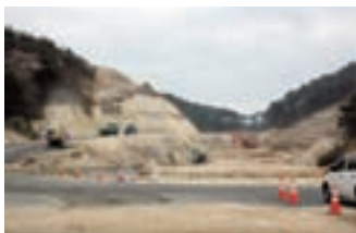
仙石線復旧工事の様子<その①>