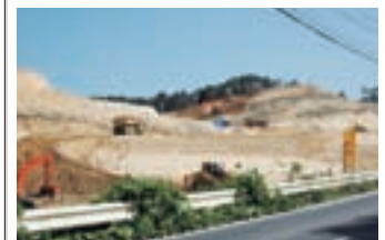
仙石線復旧工事の様子<その②>