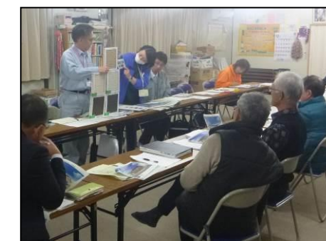
▼床タイルの色彩も検討

公共施設計画検討部会では、一丁目と三丁目に整備される集会所について、名称や色彩、配線図面等を検討しました。両集会所とも完成予定は平成28年3月末の予定です。集会所は利用用途により使い分けできるように整備されますので、あおい地区の居住者はどの集会所も利用可能です。