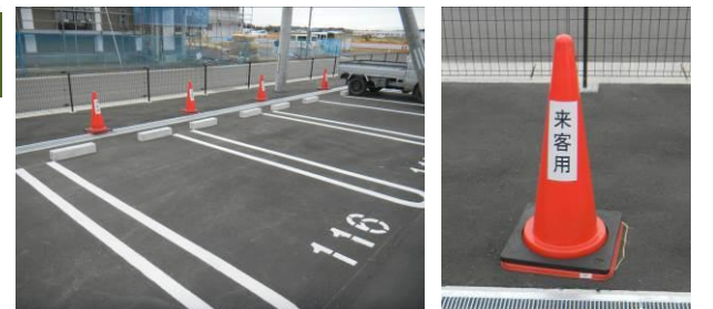
▲赤いカラーコーンが目印です

集合住宅の来客用駐車場は、集合住宅敷地内西側にあります。来客用駐車場には赤いカラーコーンが立てられていますので、来客の際にはそちらに駐車していただくようお願いします。1月13日時点で、駐車場番号116～122が来客用です。