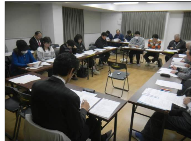
▲市営あおい住宅集会所で会議を行っています