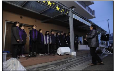
▲ゴスペルソングのコンサート 利府町のボランティアグループ「オアシスライフケア」