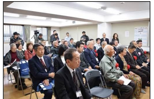
▲多くの方にご参列いただきました