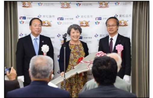
▲入居者代表への鍵の引渡し