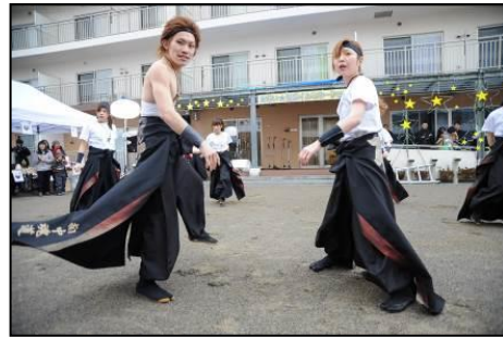
▲迫力のよさこい！！ 札幌市のよさこいチーム「極め組」