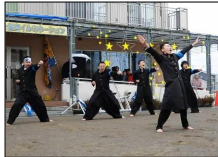
▲あおい地区での生活を応援！ 仙台市「青空応援団」