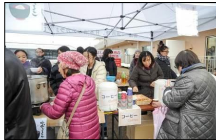
▲「オアシスライフケア」の方々に より温かい飲み物等が振る舞われました