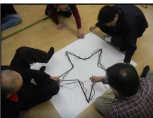
▼電飾を星の形に成形