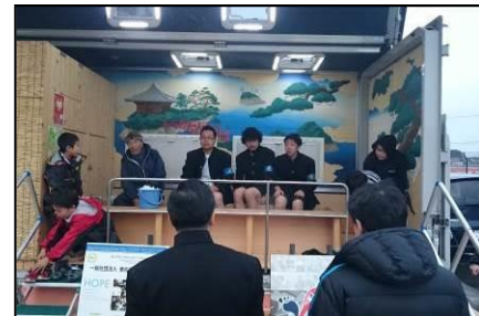
▲寒い中で入る足湯は格別！ 「HOPE（東松島みらいとし機構）」 の足湯カー