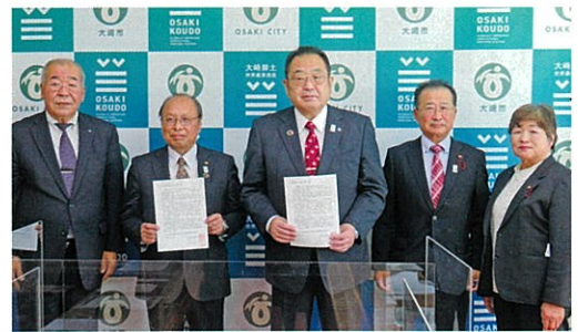
女性委員登用促進要請活動(R4大崎市)