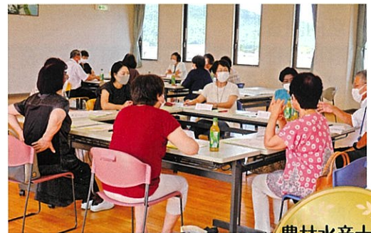
地区別懇談会(R4柴田町)