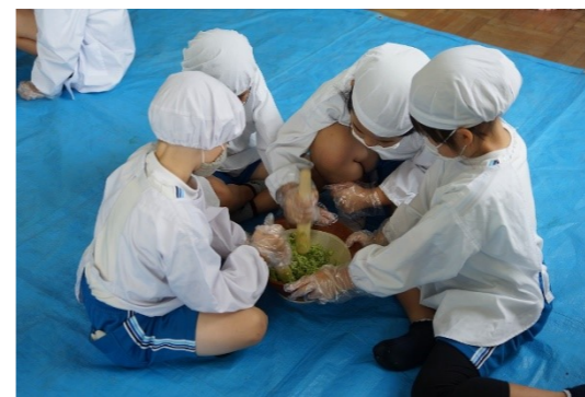
大豆は枝豆の状態ですんだにして味わいます。