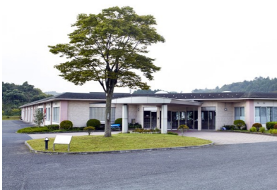
キャップハンディ体験をする介護老人保健施設「さつき苑」

大塩小学校では、学年の段階に応じてボランティア活動や縦割りの活動を取り入れた体験活動で福祉の実践力を高める教育活動を進めています。