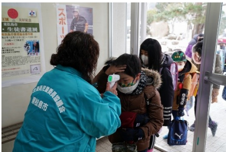
新型コロナウイルス感染防止に民生児童委員の方も検温の協力

大塩小学校の学校運営協議会には、主に大塩地区教育懇話会のメンバーが多く関わっていますが、民生児童委員をしている委員もあり、この度の新型コロナウイルス感染防止に、児童の検温で協力していただいています。